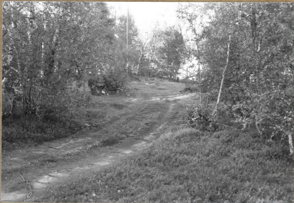
Kohde 1 - kodansija. Kuvan keskellä 81131 auton kääntö- ja parkki paikka, jonka keskellä on soikea järvenne. Oikealla Siuttajoki. SW:stä.