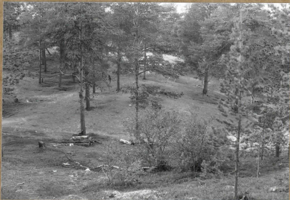
Kohde 3 - pyyntikuoppia. Kuoppari 81130 alkaa kuvan vasemmasta reunasta ja etenee tästä viistosti ylöspäin. Toinen - ei erottuva -kuoppari on tästä oikealle. Oikealla Siuttajoki. S:stä.