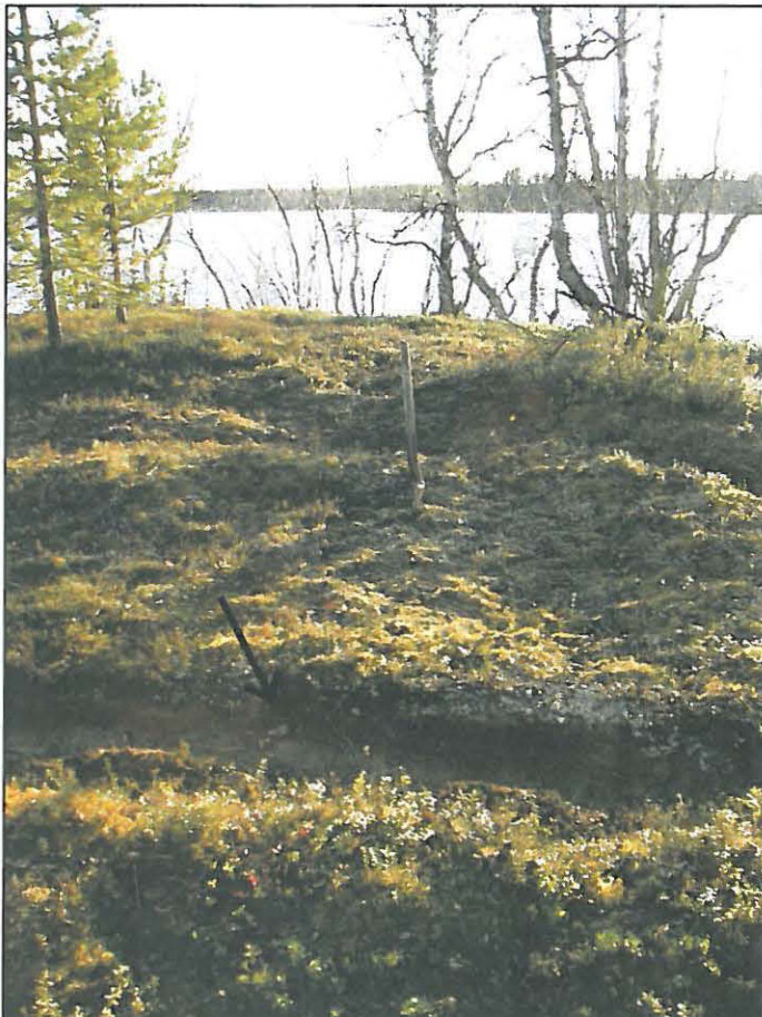
Kuva 2. Kuvassa näkyy puhdistettua polun pintaa ja taustalla lapiolla merkitty koekuopan paikka sekä rantaterassin reunaa (kuvaussuunta 275°). Nuoli osoittaa kahta palanutta kiveä. Niiden oikealla eli pohjoispuolella polun profiilissa näkyy tummaa kulttuurikerrosta ja hiiltä vajaan metrin matkalla.