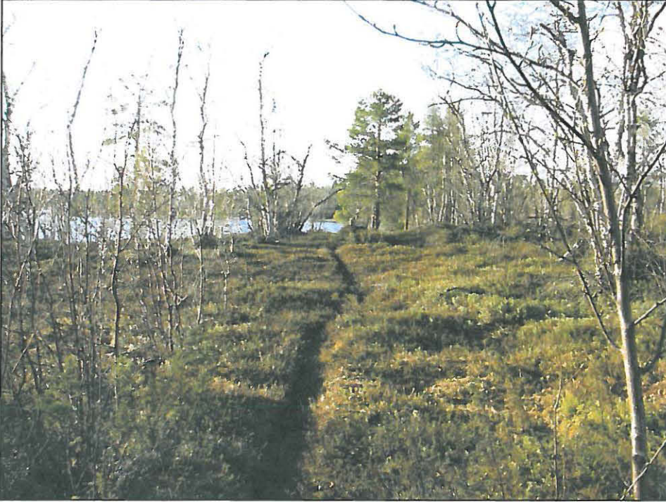
Kuva 1. Käyräniemen asuinpaikka kuvattuna samalta paikalta kuin vuonna 1983, (kuvaussuunta 355°). Puustoa on huomattavasti harvennettu. Polun mutkan jälkeen on tasanne, johon tehtiin koekuoppa ja joka kairattiin 50x50 cm verkolla.