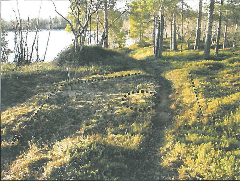
Kuva 3. Lapio on pystyssä koekuopan kohdalla. Koekuopasta löytyi hiiltä ja kulttuurimaaläikkiä (kuvaussuunta 10°). Liesikiveyksen sijainti on merkitty kuvan keskelle paksulla katkoviivalla. Matalat vallit on merkitty pienemmällä katkoviivalla.