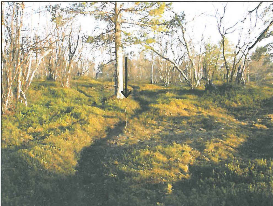
Kuva 4. Liesikiveys on merkitty maastoon oksalla (kuvaussuunta 185°). Yöauringon alhaalta paistavassa valossa kiveystä ympäröivät matalat vallit näkyvät selvästi.