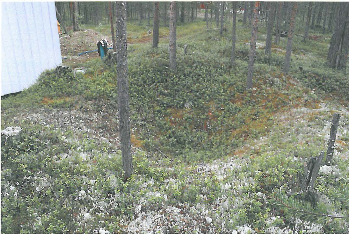
Pyyntikuoppa 3 Tarvaisen pihassa, autokatoksen itäpään eteläsivulla. Länsilounaasta.