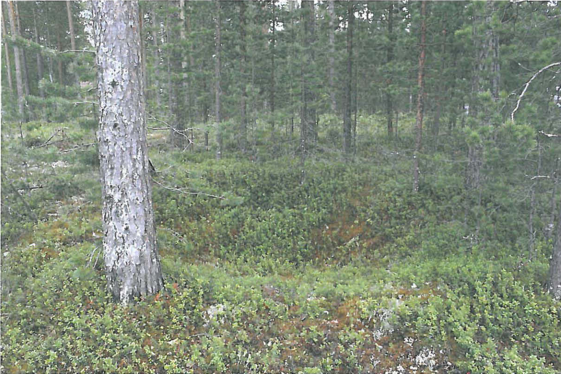
Pyyntikuoppa 2 Tolosentien 131 eteläreunassa. Pohjoisluoteesta.