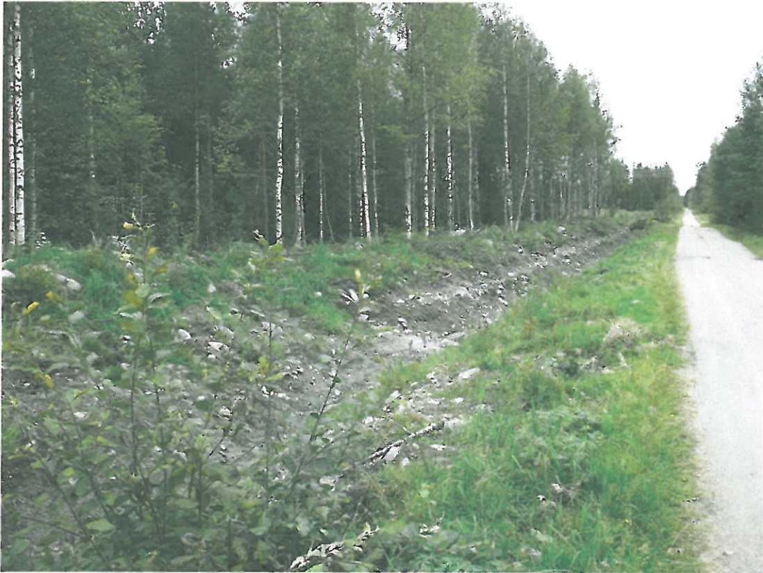
Kuva 1. Metsäautotie, jonka vasemmalla puolella kivikautinen asuinpaikka. Kuvassa näkyvissä kaivettua ojaa. Kuvattu koillisesta.