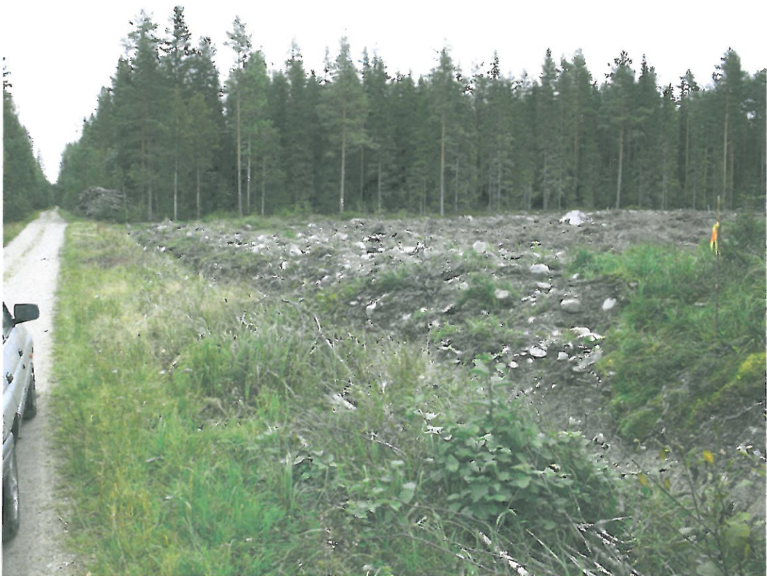
Kuva 2. Metsäautotien vieressä olevaa äestettyä aluetta, josta tunnetaan tien vierestä kivikautisia asuinpaikkalöytöjä. Kuvattu lounaasta.