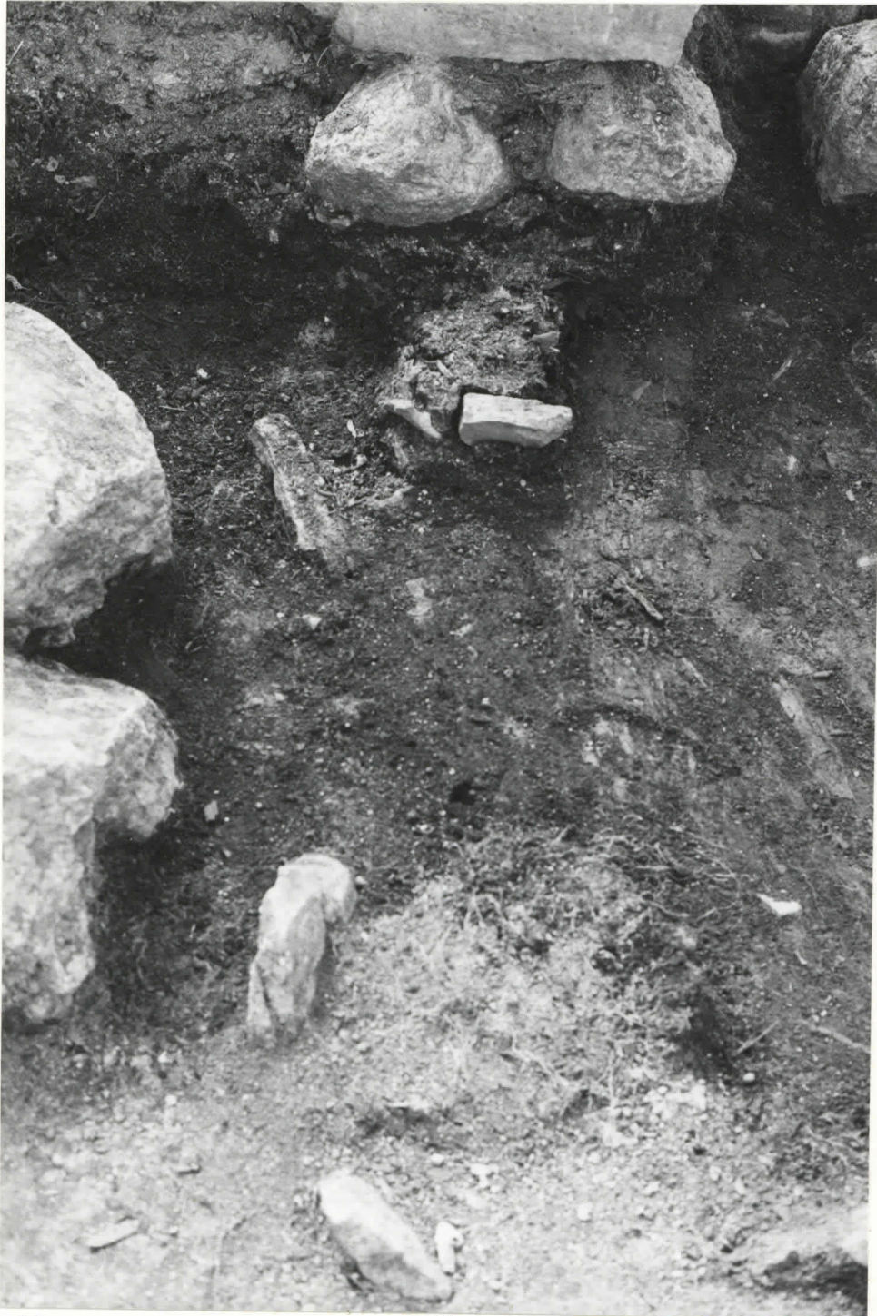
Kuva 5. Paalunjäljet itä-suunnasta vinosti ylhäältä päin kuvattuina. Kaivauskohta B.