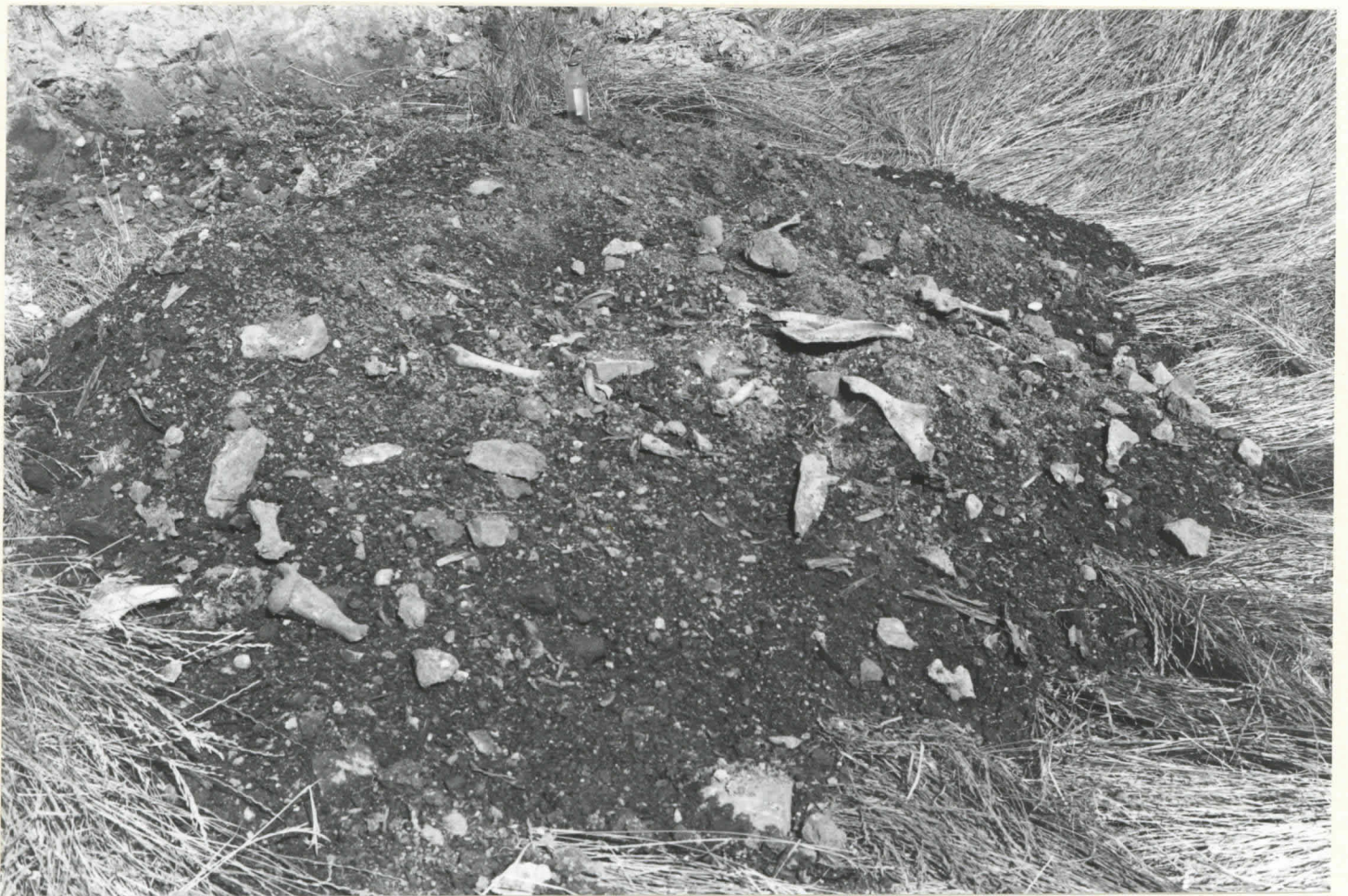
Kuva 3. Eläinten luita kaivauskohdasta F.