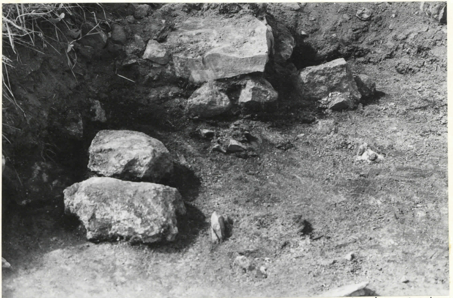
Kuva 4. Kaivauskohta B. Kuvan keskellä paalunjäljet ja taustalla toista, itäisempää kivijalkaa. Kuvattu idästä.