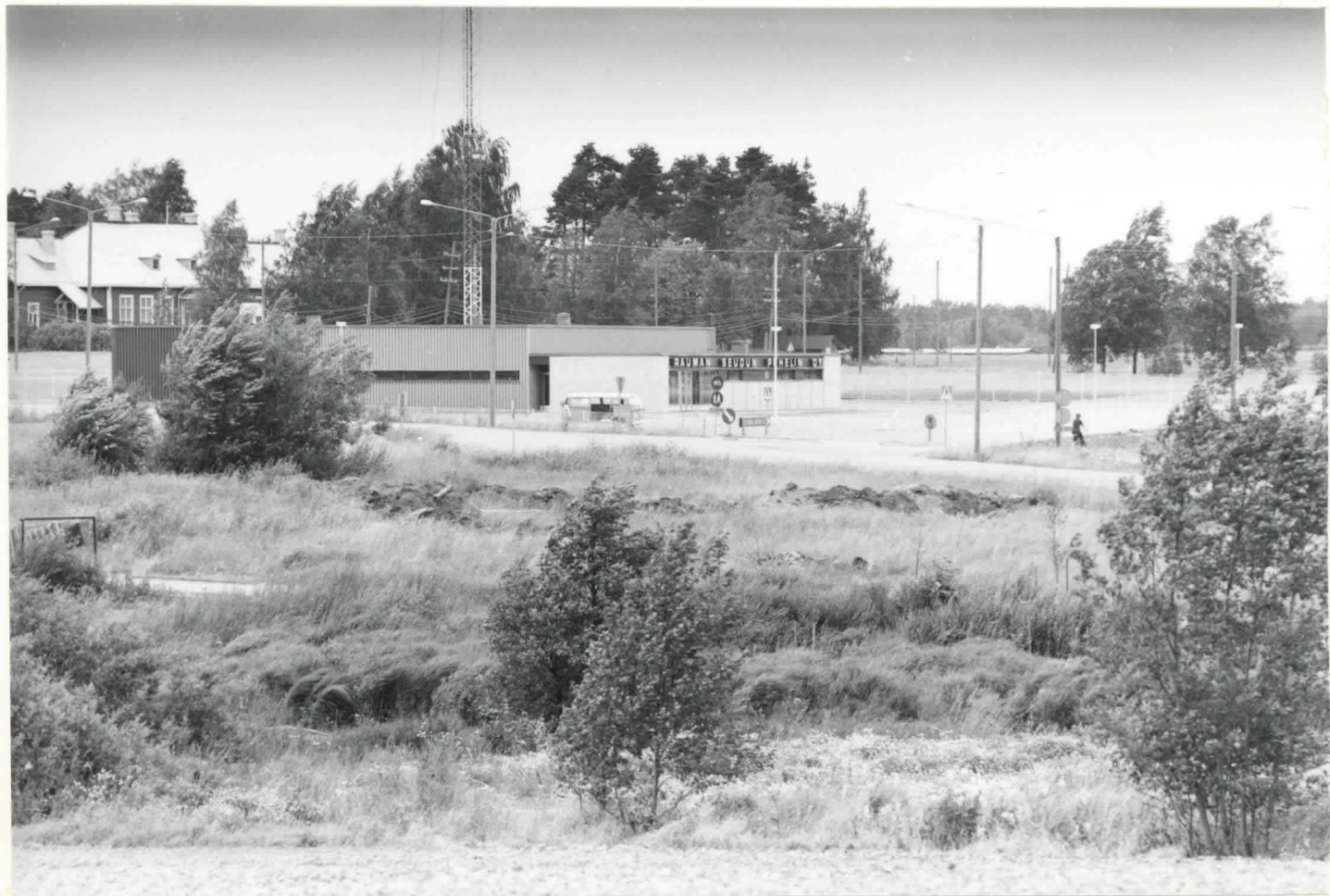
Kuva 2. Kauttuan entinen kyläpaikka kuvattuna kaakosta. Keskellä näkyvät kesällä 1975 tehdyt koeajat.