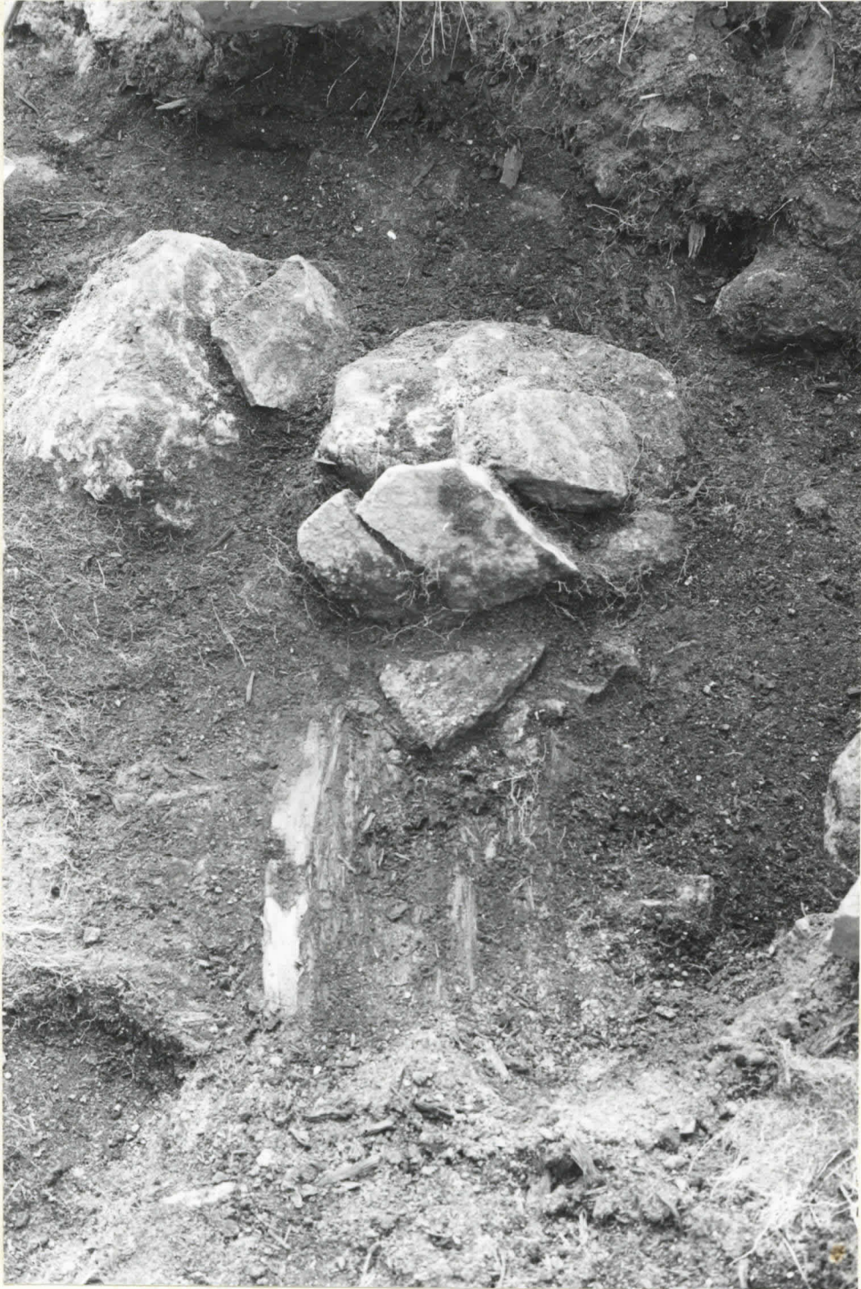
Kuva 6. Maatunutta puuta savikerroksessa, kuvattu pohjoisesta. Kaivauskohta B.