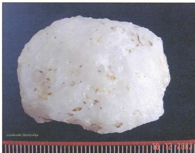
Kvartsikaavin. terä ylhäällä ja vasemmalla. Alla mitaväli 1 mm.