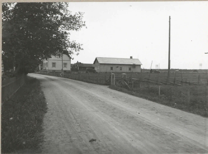
2. Sama löytöpaikka - makasiinirakennus lev. 8136. keskeä kuvaa.