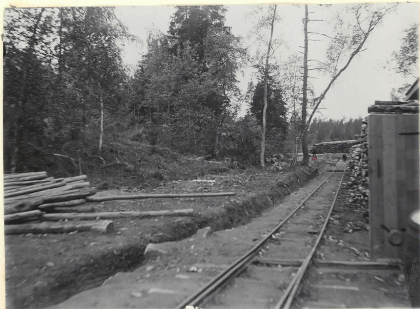
9. Spårvägen från Kauttua bruk till 2976. brukets brygga vid norra ändan af Pyhäjärvi. Vid x fyndstället för ett vikin- garvård (H. M. 5334:1). Bilden är tagen från bryggan.