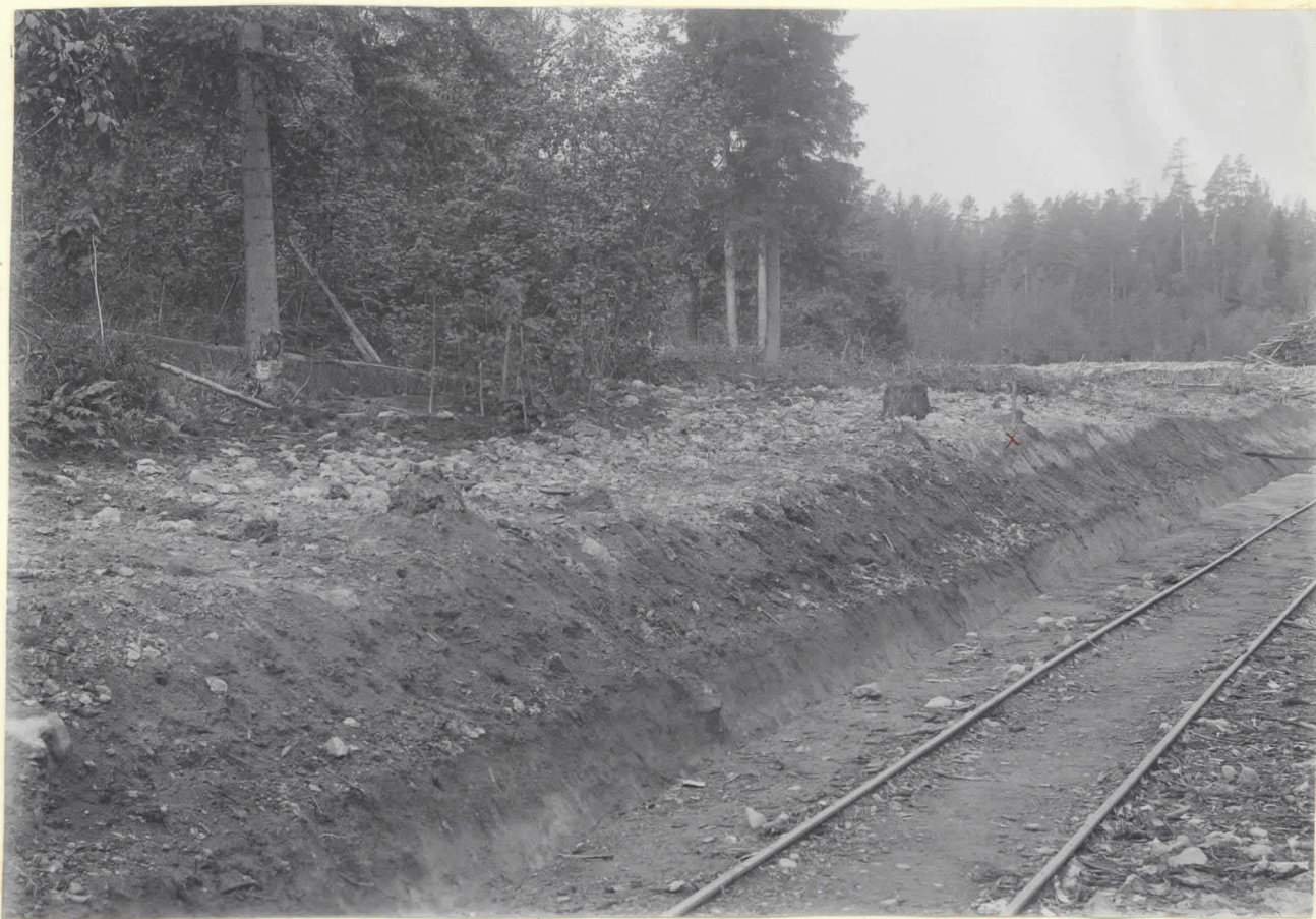
10. Se ofvan. Vid x svärdets H. M. 5334:1 fyndställe, under den på bilden synliga påskallade leran. 3090.