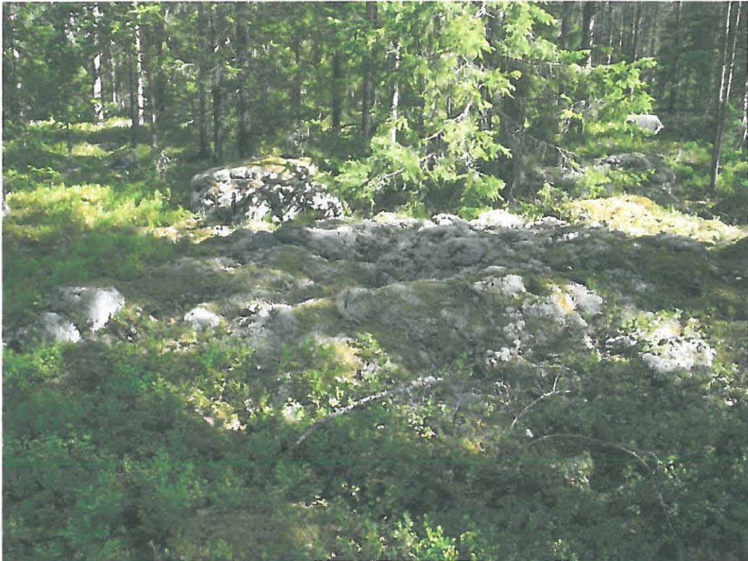
Kuva 3. Röykkiö 3 oli maastossa selvimmin havaittavissa. Röykkiön keskellä on matala painauma, muodoltaan se on pyöreähkö ja kooltaan noin 3 x 3 metriä.