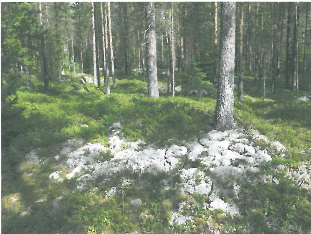
Kuva 4. Röykkiö 6 oli myös vahvan turpeen alla.