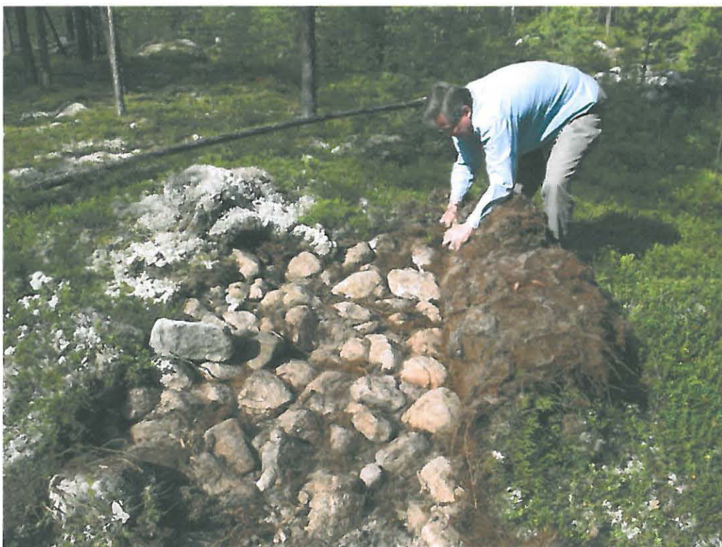
Kuva 2. Röykkiö 1:n kiveystä turpeen poiston jälkeen.