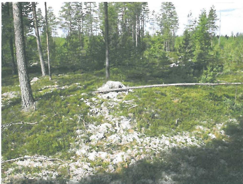
Kuva 1. Röykkiöistä läntisin, röykkiö 1, oli kuten kohteen muutkin röykkiöt vahvan turpeen alla, vain vaivoin silmämääräisesti havaittavissa.