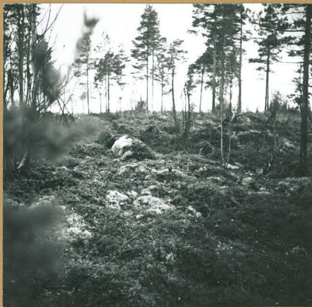
RÖYKKIÖ 1: kuvattu kaakosta