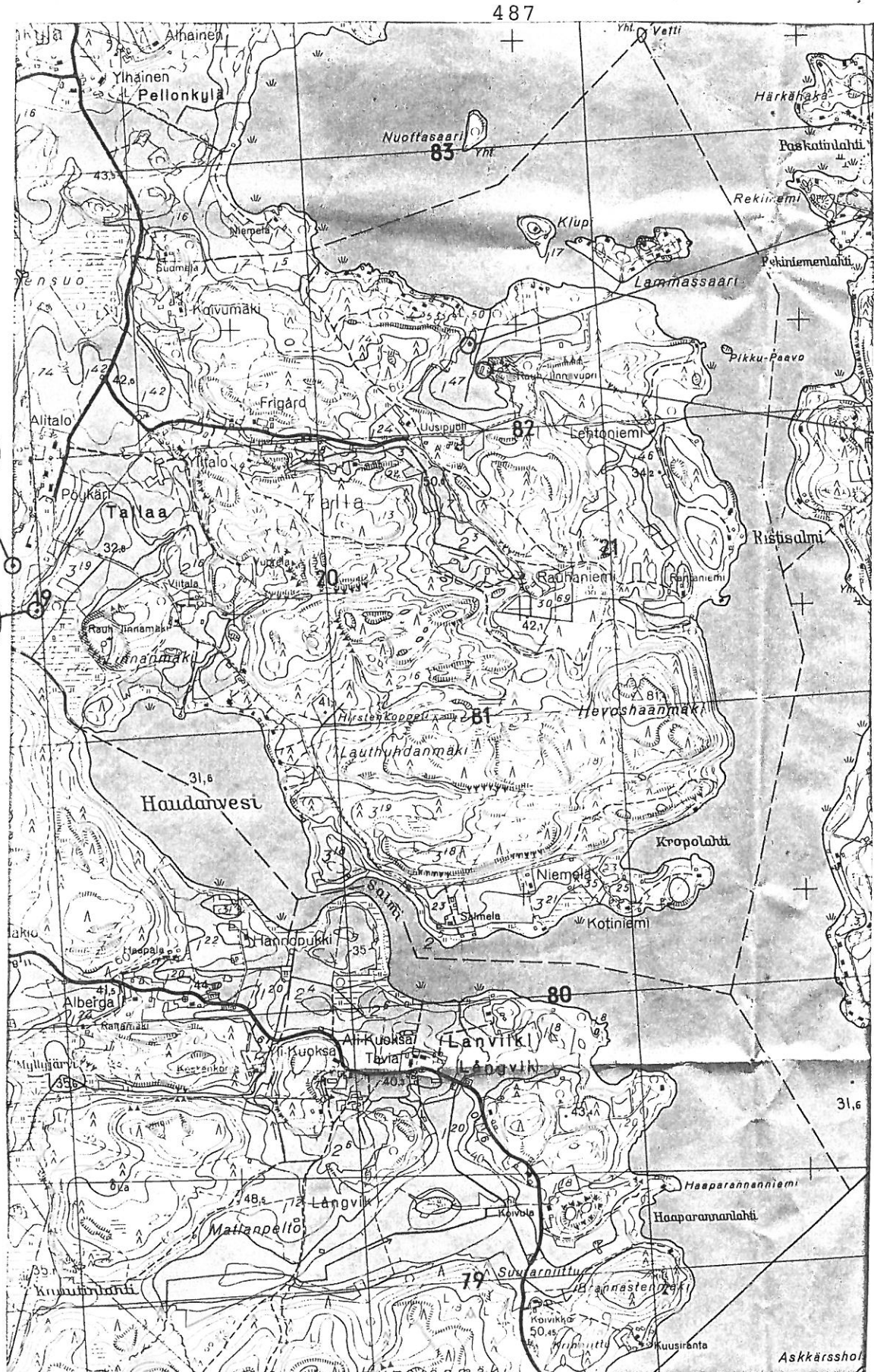
Peruskarttaote 2014 09 SÄRKIÄ, 1:20000 (1966).

ks. kartanoma Tallinnin Pöytäniemi kirkonmaasta