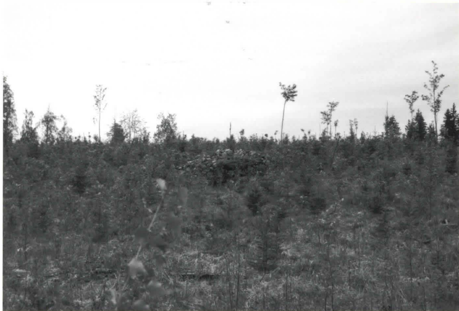
Iso kiviröykkiö Murtomäen koillisrinteellä, N-S. 1.6.2005. (139978).