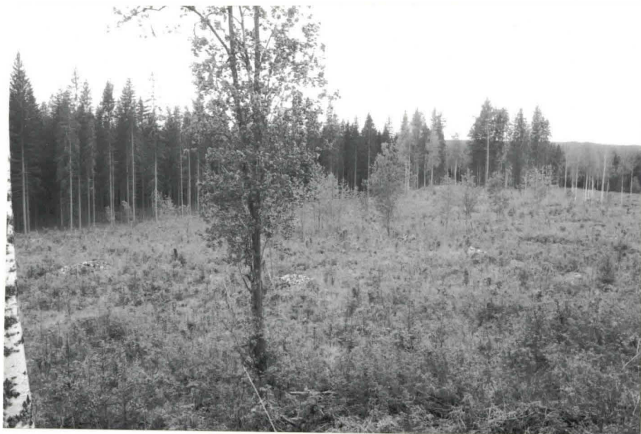
Röykkiöitä hakkuualueella Murtomäen lounaisrinteellä, E-W. 1.6.2005. (139979).