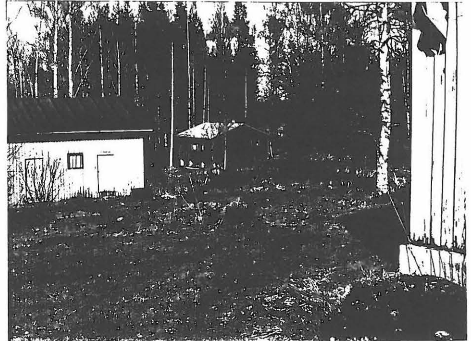
KUVA 2 : LÖYDÖT KERÄTTIIN KESKELLÄ NÄKY- VÄN MÖKIN PÄÄSSÄ KÄÄNNETYLTÄ KAS- VIMAALTA. 6x4,5.