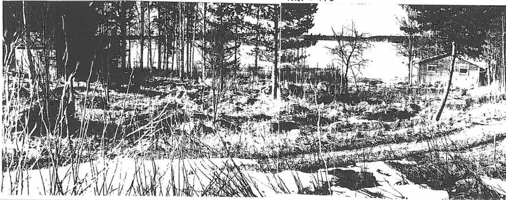
KUVA 3 : TALLUSJÄRVEN KIVIKKOISTA RANTAA. ASUINPAIKKALÖYDÖT OIKE- ALLA NÄKYVÄN MÖKIN EDESSÄ KÄÄNNETYLTÄ KAS- VIMAALTA. KÄRRYTIE VIE OIKEALLE, SIVUSMETSÄN LÄR- KEEN, SIVUKSEN TALON PIHASTA.