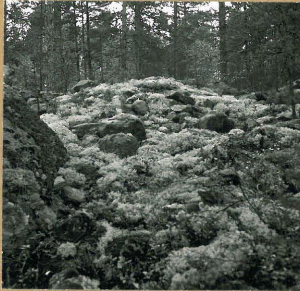
neg. 72048 Aitasalon kiviroykko. Lounasta.