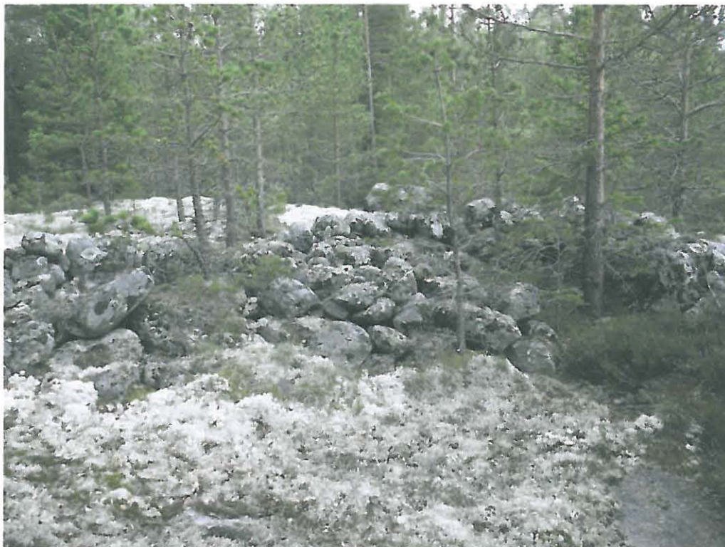
Kuva 3. Säilynyt röykkiö a, jonka pituus on noin 24 metriä. Röykkiö sijaitsee suunnitellun ottoalueen lounaispuolella.