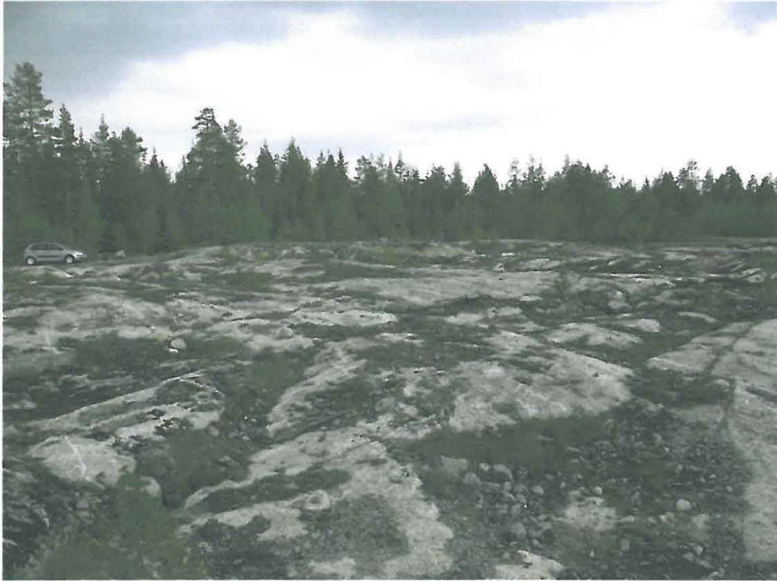
Kuva 1. Maa-aineksesta kuorittua kallion pintaa. Röykkiö a sijaitsee metsikössä, kuvan oikeassa laidassa. Röykkiö b on sijainnut kuoritulla alueella.