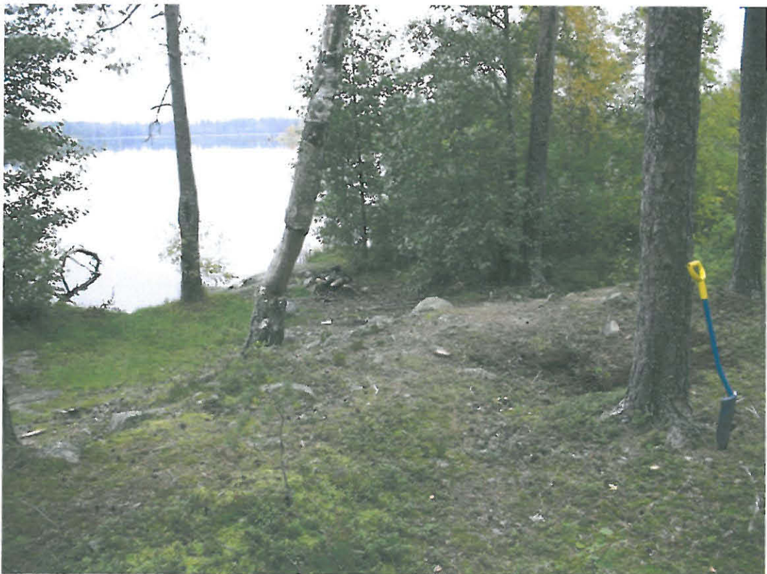
Kuva 2. Löytökeskittymä on männyn kohdalla, jossa näkyy punertavanruskeaa maata.