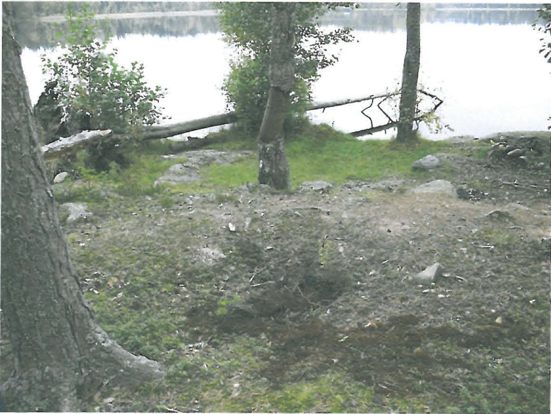
Kuva 3. Maa koekuopassa oli erittäin punertavanruskeaksi värjäytynyttä.