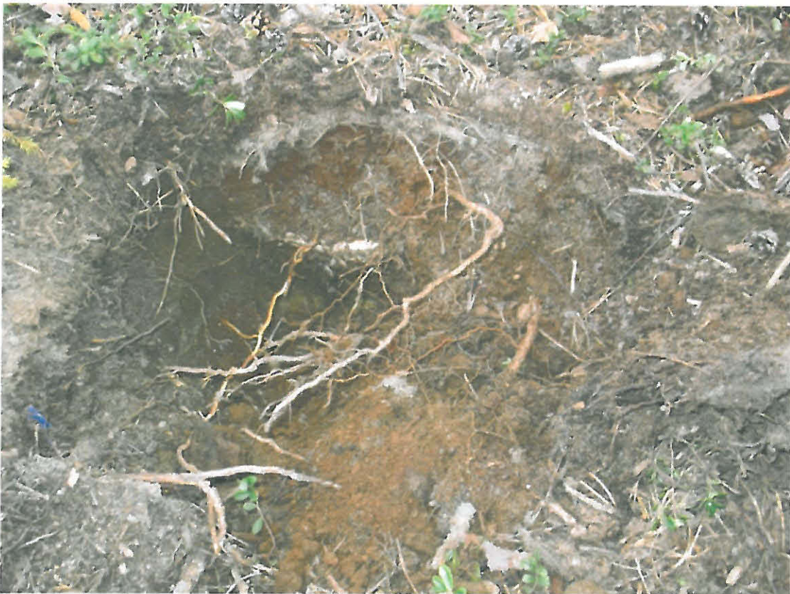
Kuva 4. Rautakuonaa tuli koekuopasta erittäin runsaasti.