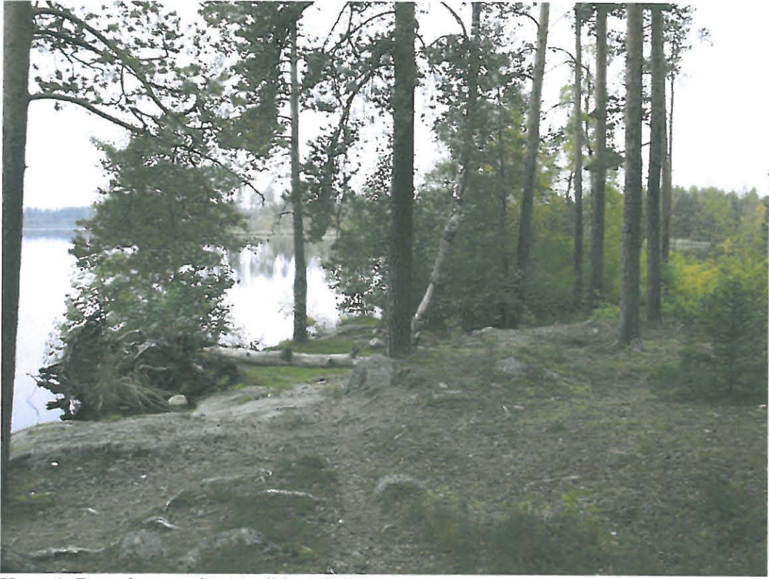
Kuva 1. Rautakuonan löytöpaikka Ojutjärven rannalla.