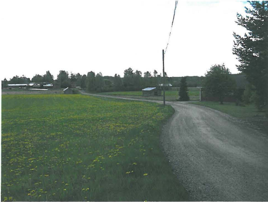
Kuva 1 lounaaseen. 70 m käyrälle laskeva niemi. Ei tarkastettu, pääosin pihamaata ja tiepohjaa.