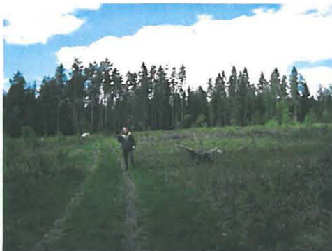
Uutela. Metsäalue, joka alun perin viljelys.