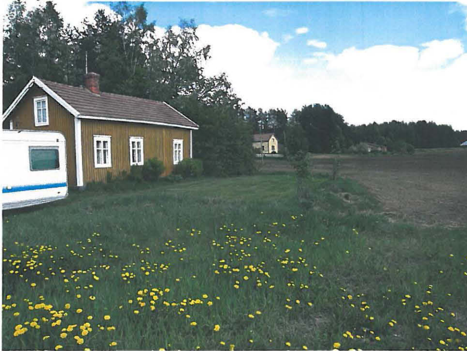
Kuva 2 koilliseen. Pelto talojen välillä on pintapoimittu. Kvartsia on pellon rajalla leikatun nurmikon edustalla, mutta ei enää kuvan oikeassa reunassa.