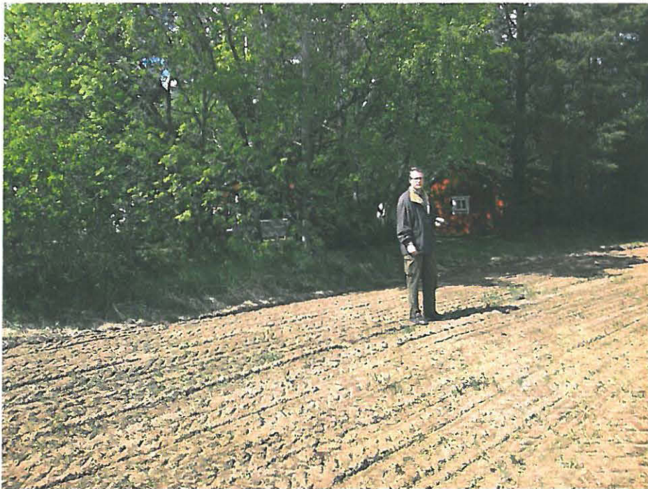
Kuva 3 luoteeseen. Keramiikan löytökohta takanani aivan pellon reunassa ja tästä pellon reunasta myös kaksi selvää iskosta. Löytöjen keskittyminen viittaa siihen, että itse löytöalue olisi pihamaalla.