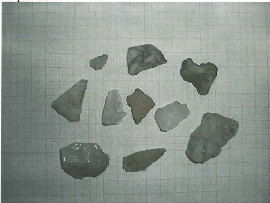
Löydöt. Keskellä keramiikka ja kaksi valkoista iskosta.