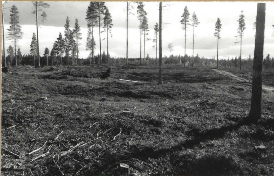
Keskellä mahdoll. asuinpaikka, kuvattu pohjoisesta