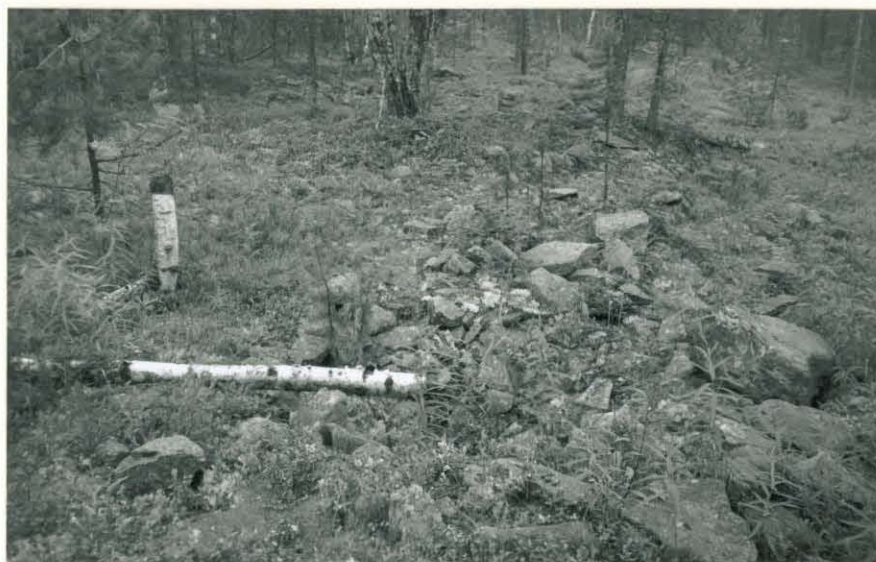
Kuva 4 F. 115196

Rovavaaran länsirinteen rakkakuoppa 2. Kuvassa piirtäjä Vesa Laulumaa, kuvattu pohjoisesta.