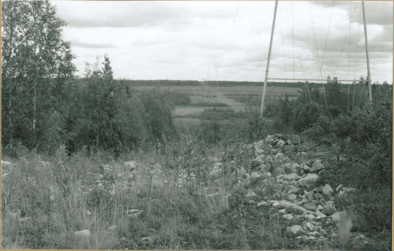
85834 Etuosalla vaaleamyrskin kivien kohdalla paikka jossa tuhautuneet röykkiöt 6 ja 7 ovat karttatietojen mukaan sijainneet.