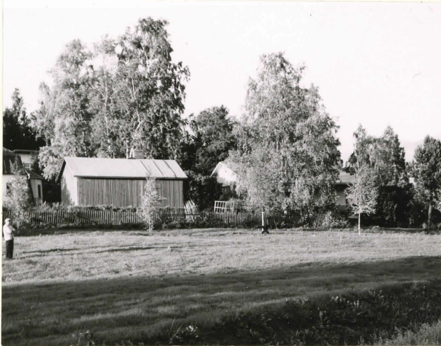
Kivikirveen löytöpaikka(x) lounaasta