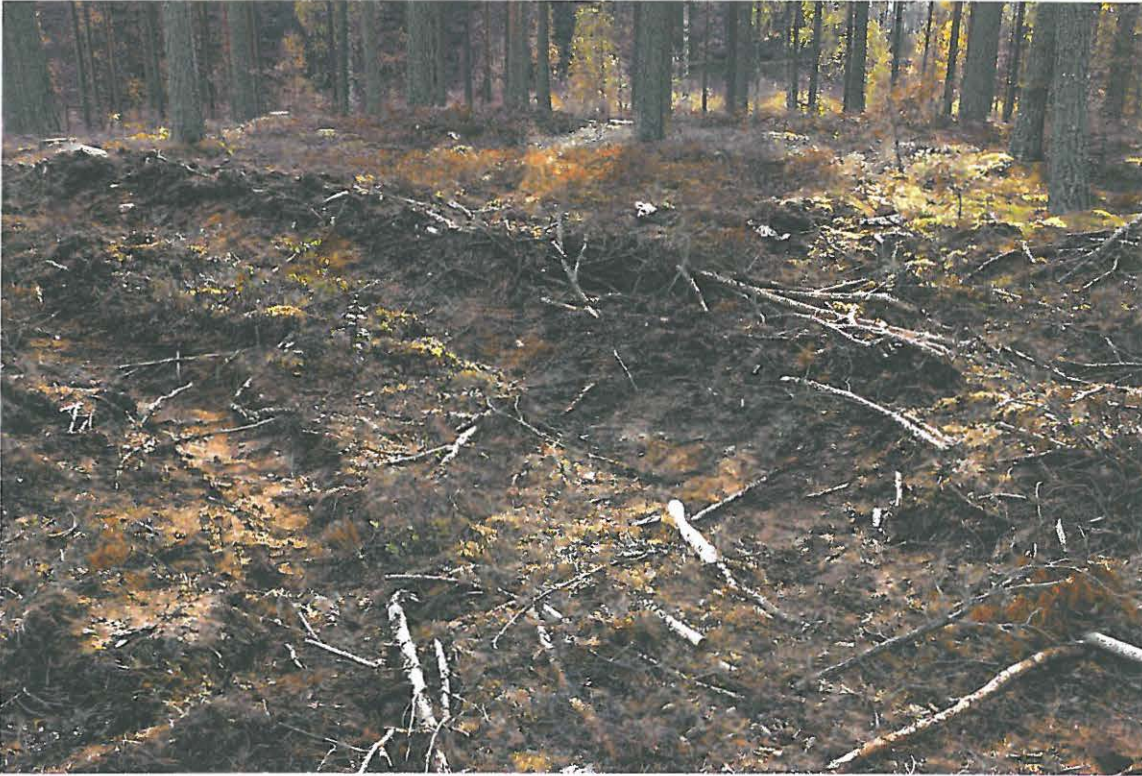
Pohjoisimman asumuspainanteen pohjoispää on osittain tuhoutunut äestyksessä.