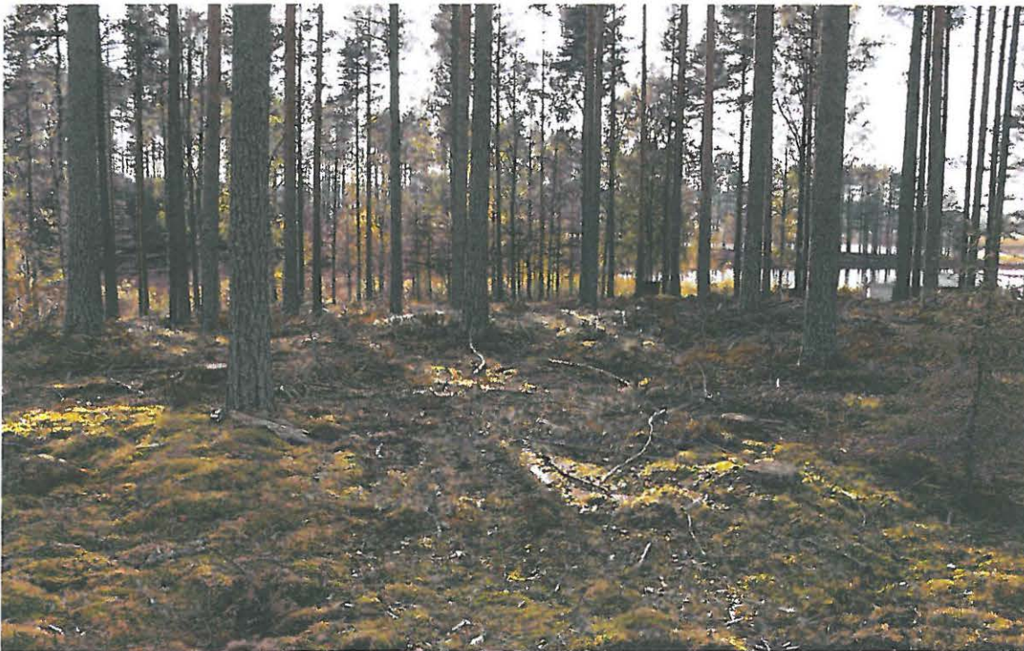
Kuvan keskiosassa säilynyt asumuspainanne. Kuvattu etelään.