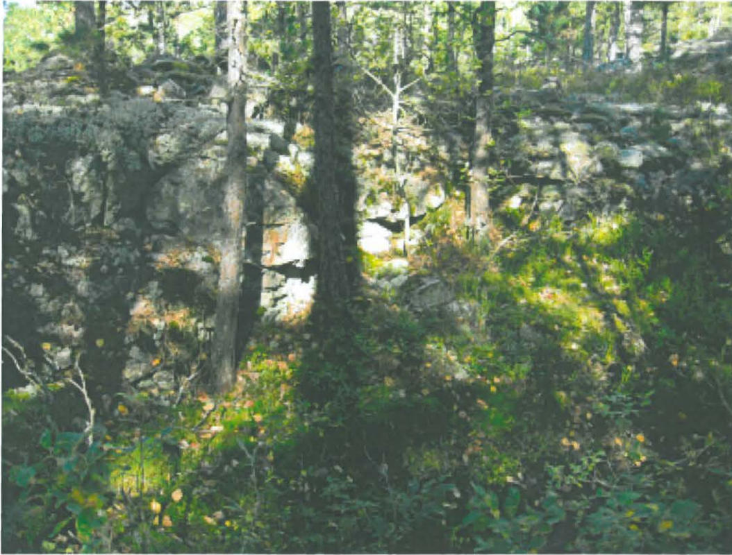
1. Kemiönsaari, Kummelberget. Kvartsilouhoksen kuoppa. Kuvattu etelästä. Valok. Heljä Brusila. DT2009:32:3 kuva 012