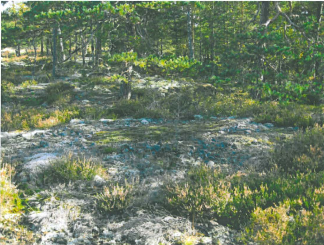
2. Kemiönsaari, Kummelberget. Majan tms pohja keskellä (vihreä alue). Kuvattu etelästä. DT2009:32:3 kuva 013