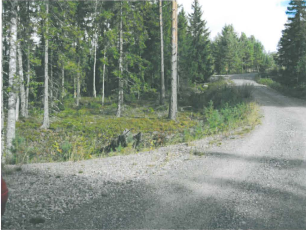
1. Råudden. Kivikautisen asuinpaikan luoteisosaa Råuddenintien ja Lemnästräsketin järven välimaastossa. Kuvattu lännestä. DT 2008:60:11 kuva 017