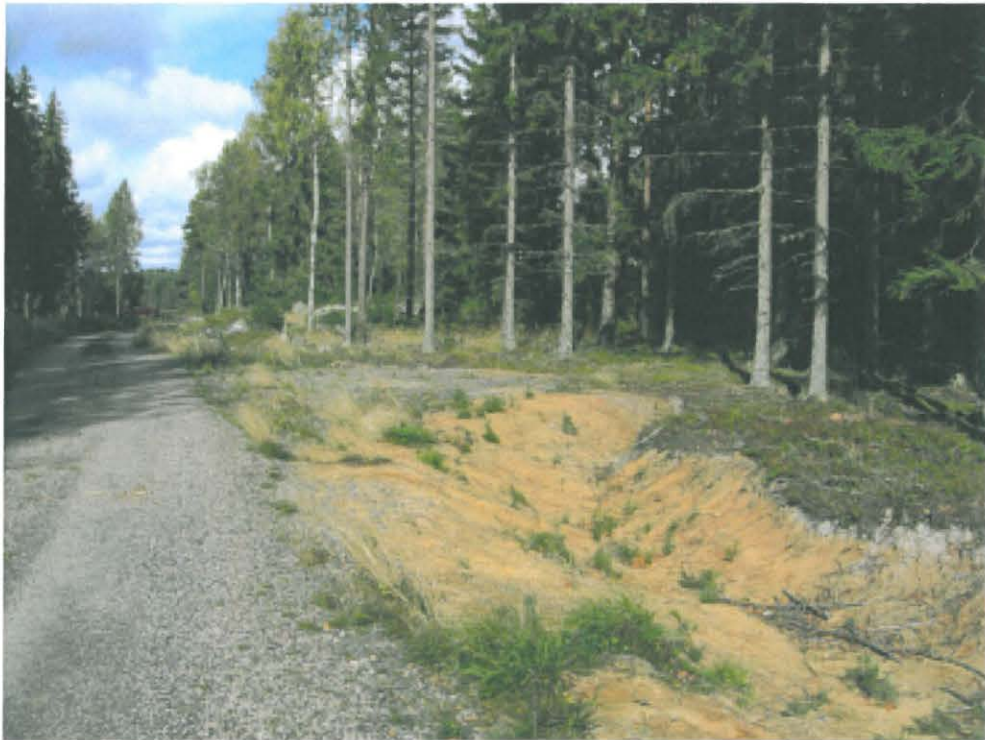
2. Råudden. Kivikautisen asuinpaikan kaakkoisosaa Joulupukintien itäpuolella. Saviastianpalojen löytöpaikka kuvan keskellä tielevennyksen reunaleikkauksen päällä. Kuvattu etelästä. DT 2008:60:11 kuva 016