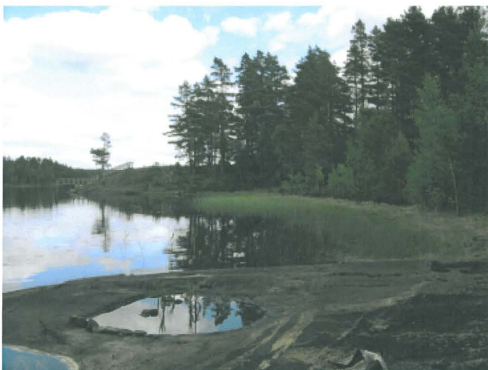
2. Lemnästrasket. Rantakalliota röykkiön edustalla, lännestä.  DT 2008:60:7 kuva 091