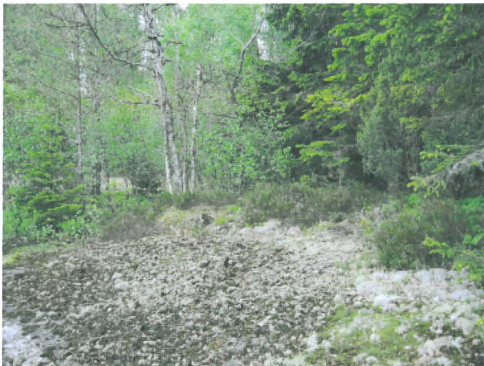
1. Lemnästrasket. Kiviröykkiö kanervikossa kuvan keskellä. DT 2008:60:7 kuva 090