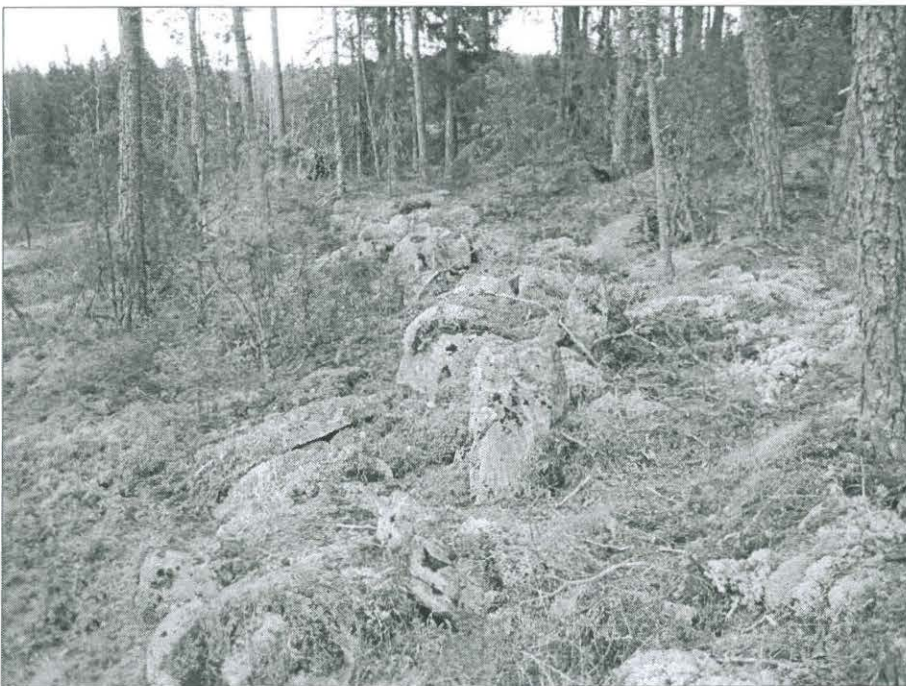
Kuva 2. Kivivalli vuoren pohjoisosassa, lännestä. (TYA 14:8)