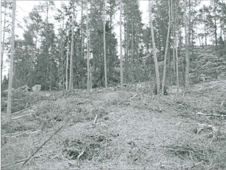
Kuva 1. Kivivalli vuoren pohjoisosassa, pohjoisluoteesta. (TYA 14:4)