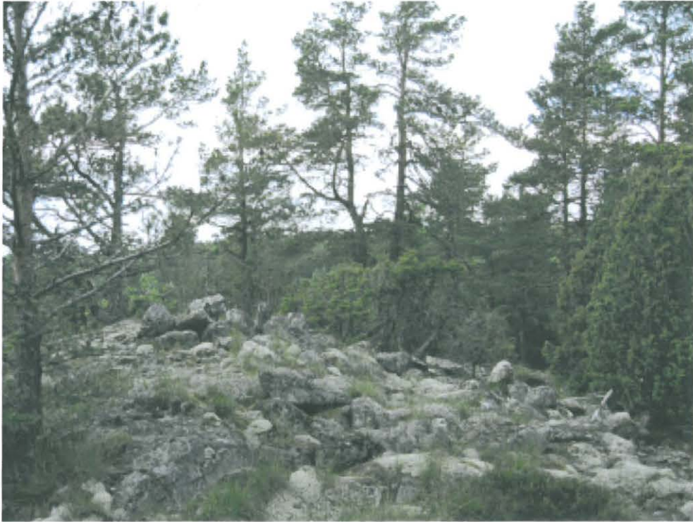
1. Fladan. Hautaröykkiön jäännökset rantakallion laella, koillisesta. DT 2008:60:6 kuva 094