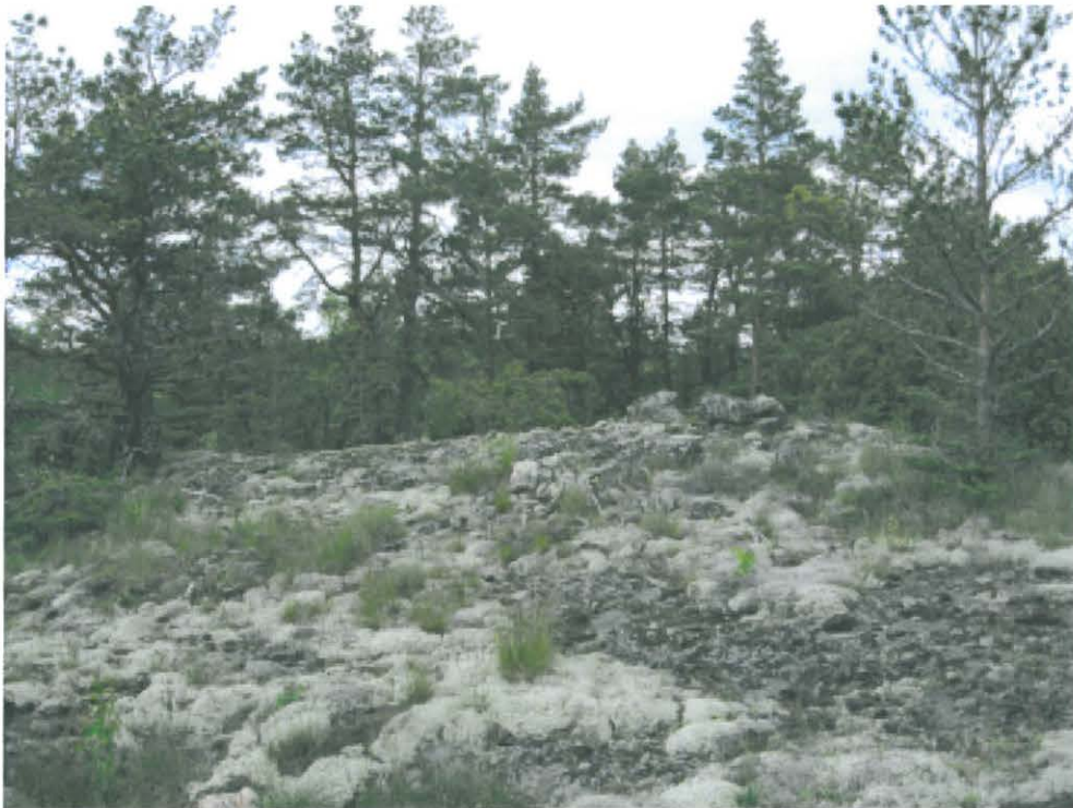
2. Fladan. Hautaröykkiön jäännökset kalliokukkulan laella, kaakosta. DT 2008:60:6 kuva 093