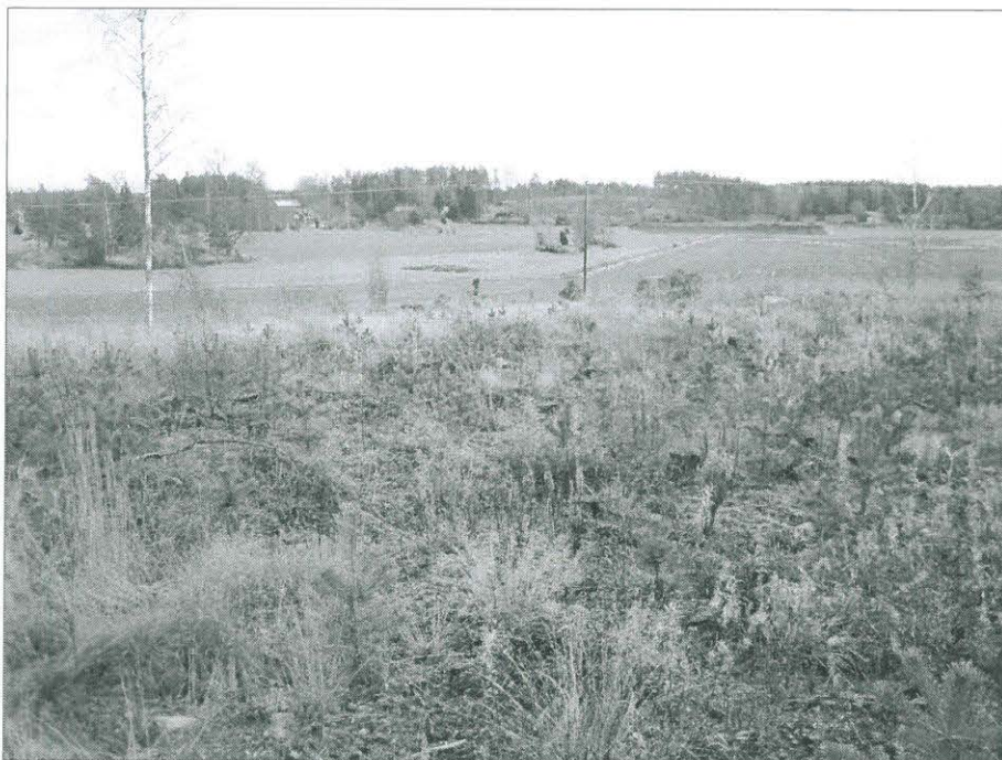
Kuva 2. Maisemaa Kåddbölen varhaismetallikautiselta asuinpaikalta kuvattuna. (TYA 12:4)