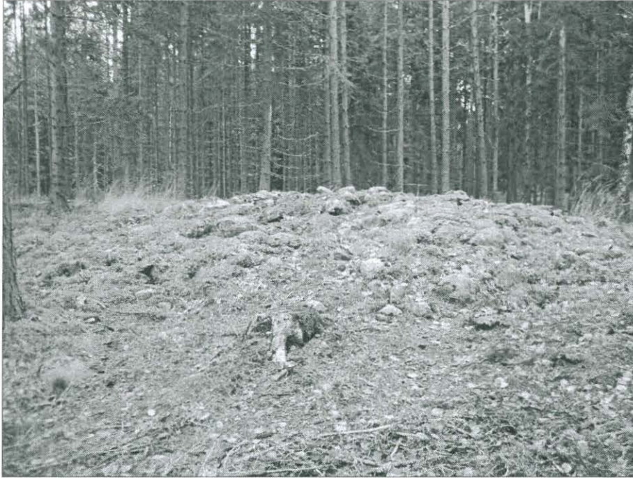
Kuva 3. Röykkiö (3). (TYA 12:8)