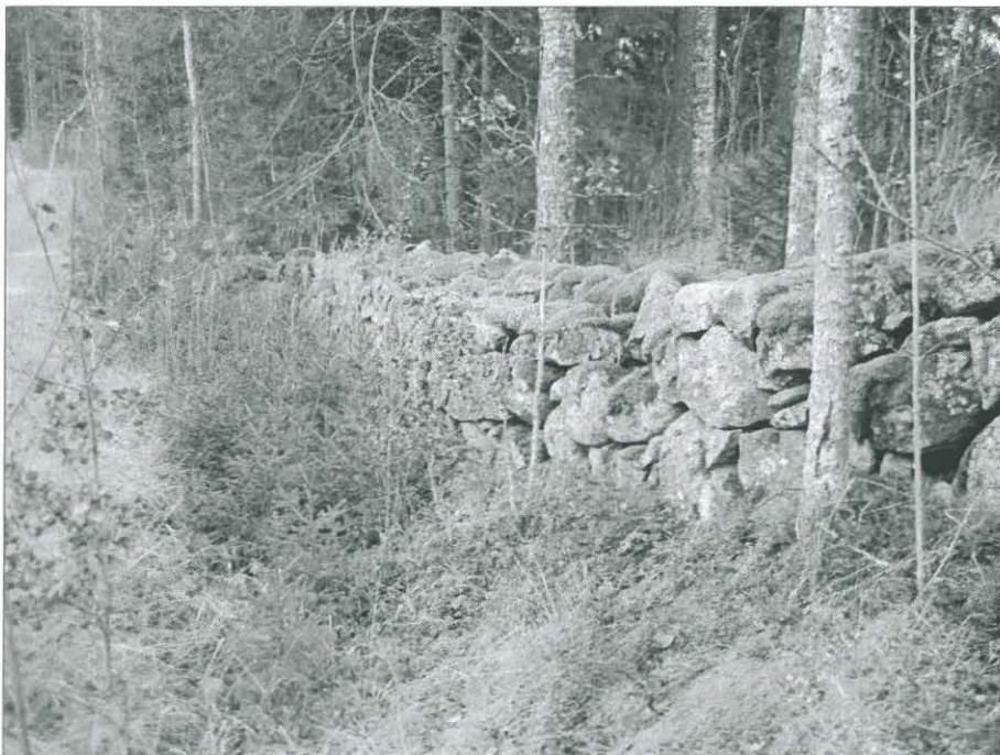
Kuva 4. Kivaitaa. (TYA 12:10)