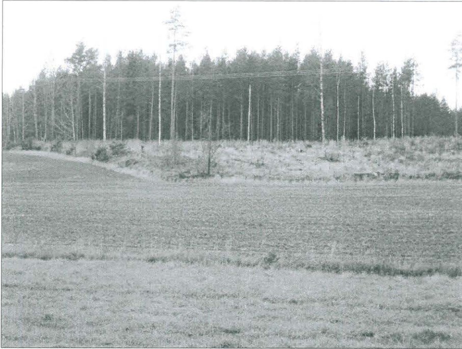
Kuva 1. Hakkuualue Kåddbölen varhaismetallikautisen asuinpaikan kohdalla. Asuinpaikka sijaitsee kuvan oikeassa laidassa. (TYA 12:1)