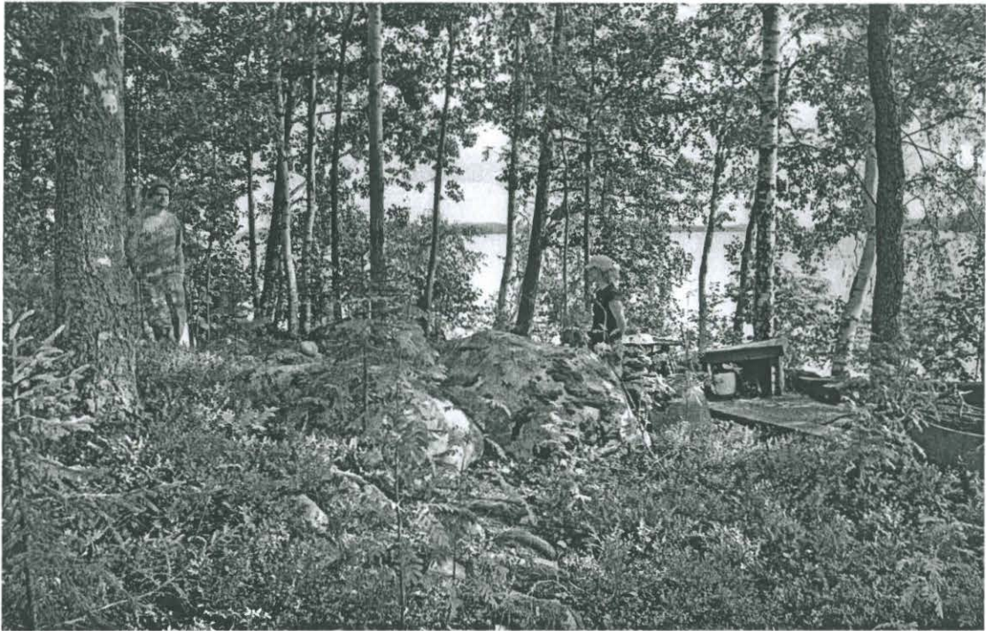
Kivi, jossa hakkauksia. NW-SE (f. 143524). Kuvannut P. Pesonen 2006.