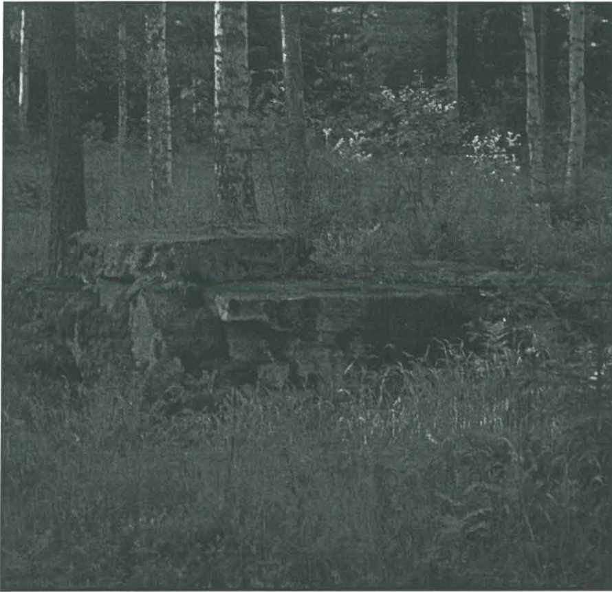
Kuva 1. Kesälahti Villala Vantkä. Kuppikivi kuvattuna idästä.