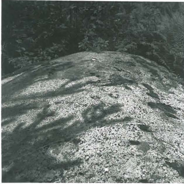
Suurahon talon metrissä oleva uhripöytä karkosta kuvattuna.