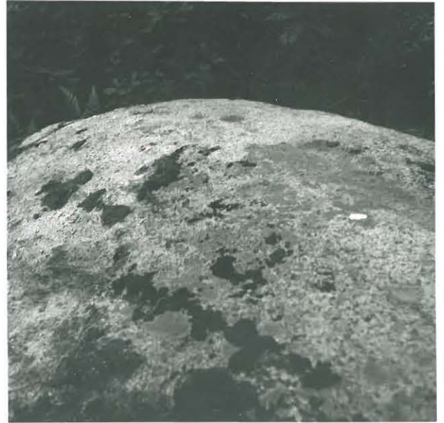
Sama uhripöytä graniitista kuvattuna.