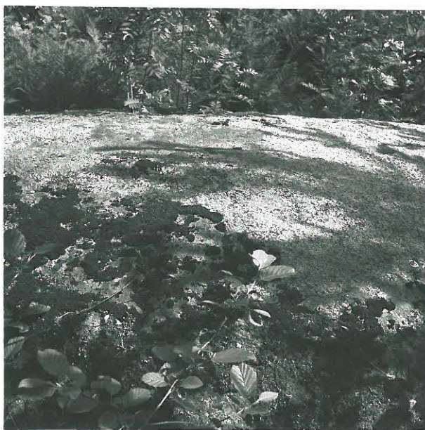
Sama uhrinki lounaisesta kuvattuna.