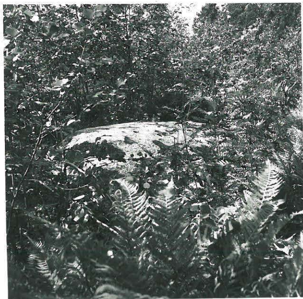
Suurahon uhrinki pohjoisesta kuvattuna. Ympäristössä tiheää sammal-, pihlaja- ja leppäkuususta.