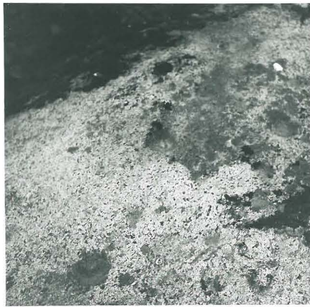
Suurahon uhripöytä idästä kuvattuna.