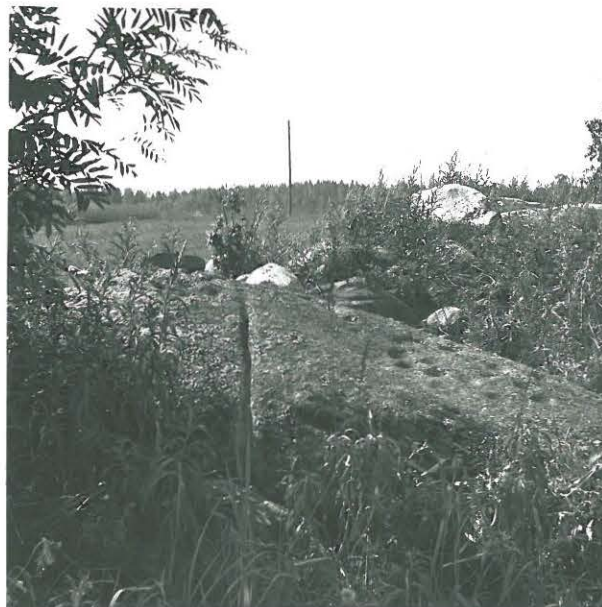
Sama uhrikivi pohjoisesta kuvattuna. Vasemmalla kaakkoisessa kiveppäryhmä (kanavat), oikealla luoteisessa kiveppäryhmä (ilmian kanavia)