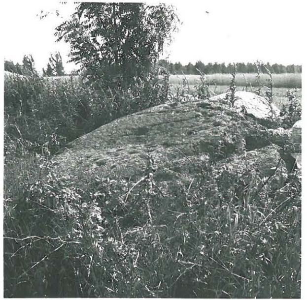
Sama uhrikivi myös lännestä. Oikealla ylhäällä kanavilla jätetyt kivet, edessä alhaalla ilmian kanavien.