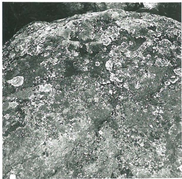
Sauvan uhrikivän korkein kohta, kuvattu luoteesta. Kuvassa kannavilla yhdistettyjä keuhkia.