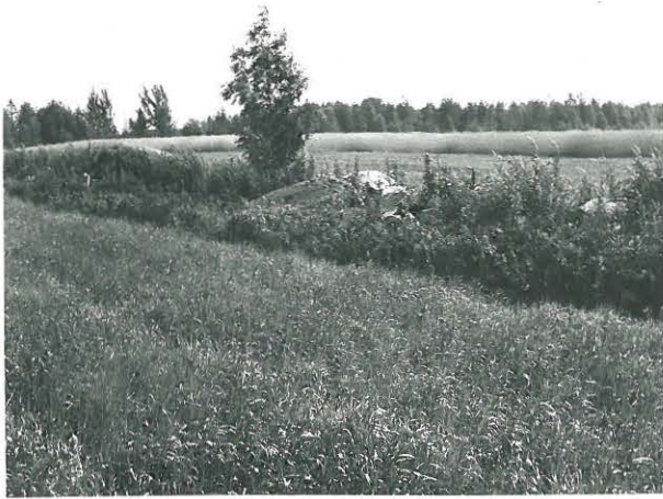
Paavolan ja Suurahon talojen rajalla oleva uhrikivi, kuvattu lännestä. Takana pihlaja.