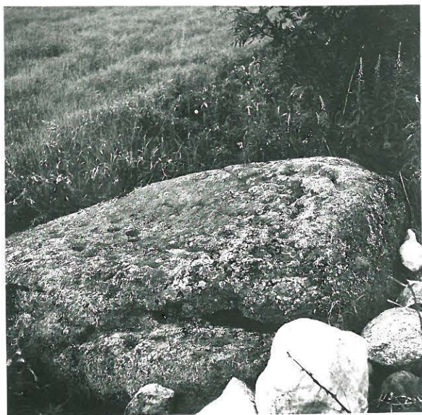
Paavolan ja Suurahon rajalla oleva uhri- kivi, kuvattu etelästä, oikealla ylläällä kannavilla yhdistetty keuhkaryhmittä.