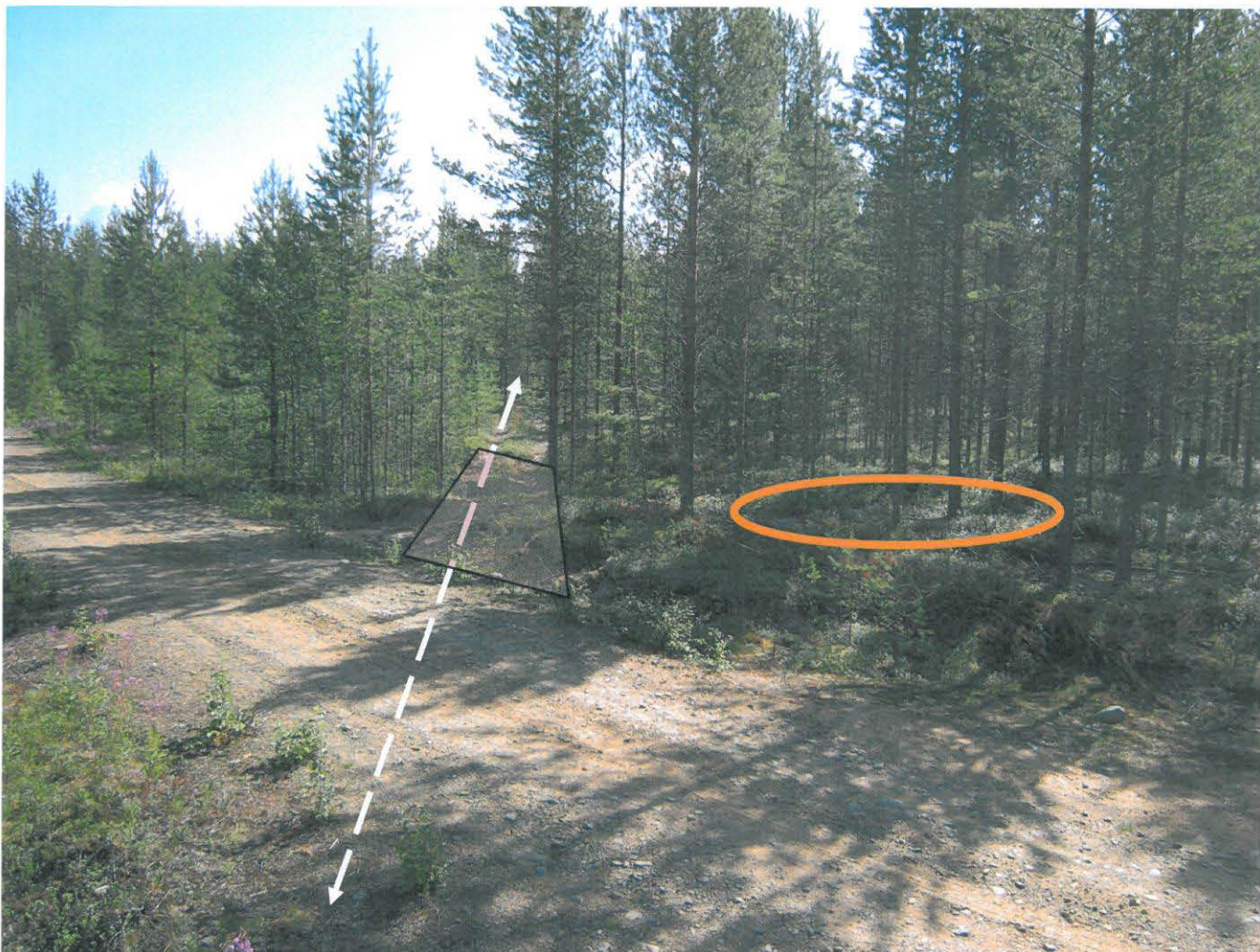
PPM DG VH 4:2009:15:5