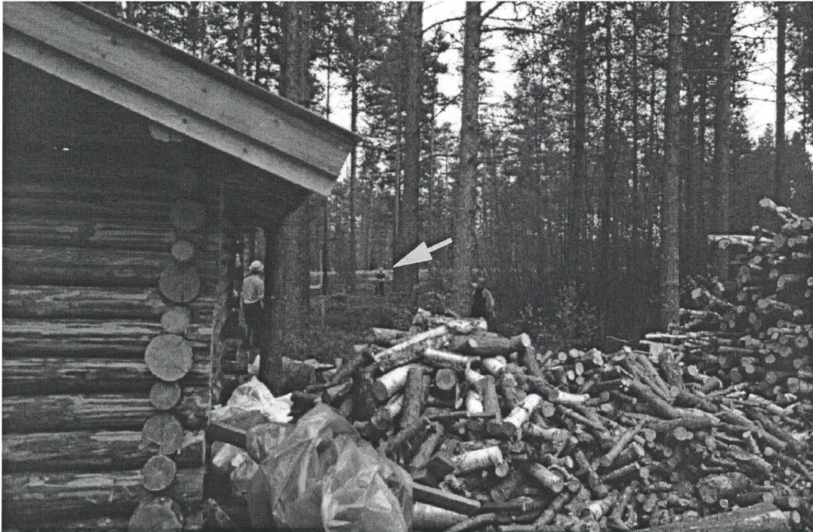
Kuva 1. Kalajoki Rautio Kivimaa. Yleiskuva asuinpainanteen sijainnista. Vasemmalla uusi lato, taustalla maantie. Nuoli osoittaa asuinpainanteen keskikohtaan. Kuvattu kaakkoon. (Kuva: Pentti Koivunen. Oulun yliopisto, Arkeologian laboratorion dia 23497).