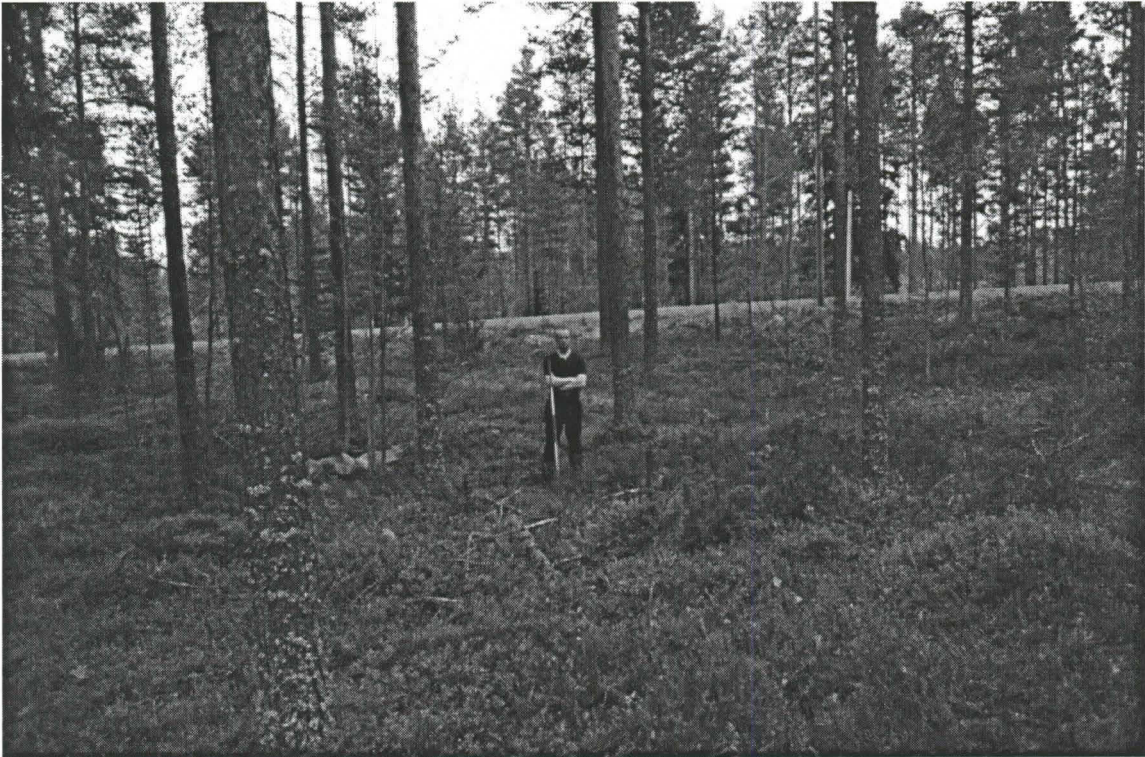
Kuva 2. Kalajoki Rautio Kivimaa. Fil.yo. Sami Viljanmaa seisomassa asuinpainanteen keskustassa. Kuvattu itä-kaakkoon. (Kuva: Pentti Koivunen. Oulun yliopisto, Arkeologian laboratorion dia 23498).