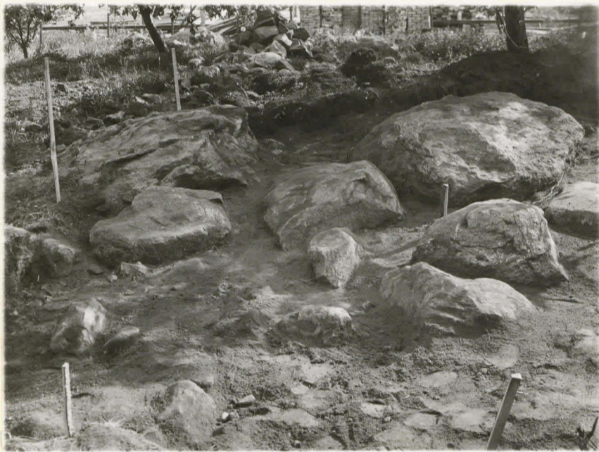
3. Röykkiön jäännös Kuittisten Loiman kl. Länsi-Suomen kansanopiston puutarhassa. Valokuva NW:stä päin.