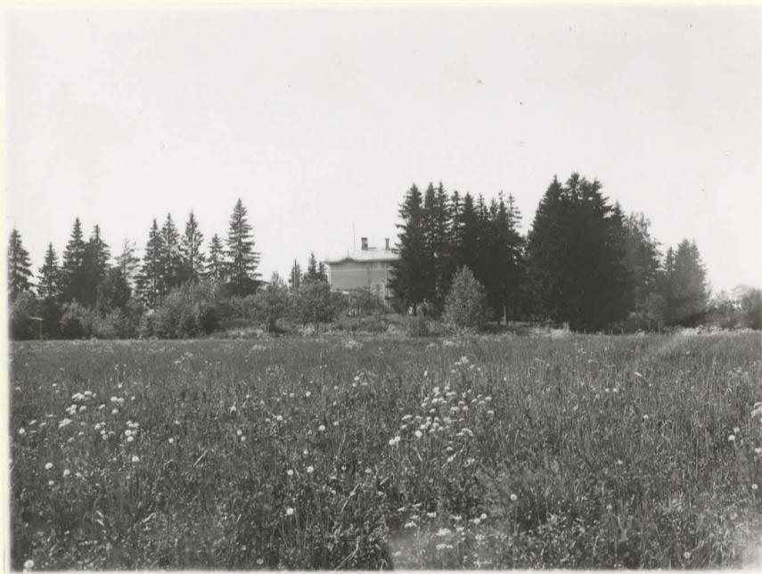
10570. 2. Huittinen, Loima, Länsi-Suomen kan- sanopisto valok. SO:sta päin. Löytöpaikka puutarhassa talon päädyssä ja pellon vä- lillä, kuusikosta vasemmalle.