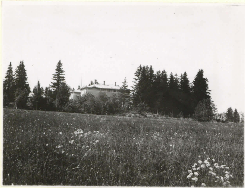
10569. 1. Huittinen, Loiman kl., Länsi-Suomen kansanopisto valok. O:sta päin. Hau- taröykkiö puutarhassa talon päädyssä ja pellon välillä.