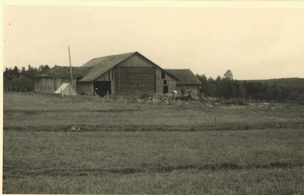
14971. Vähä-Eskelin riikan luona oleva hautakumpu tut- kittu v. 1948.