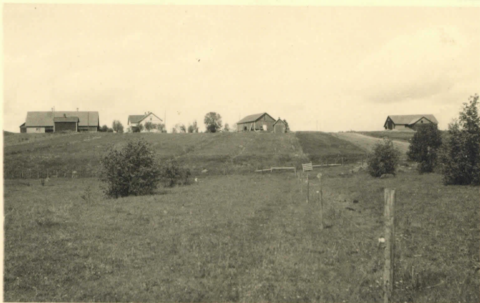
14970. Vähä-Eskelin talo, oikealla riihi, jonka edessä, päära- kennuksen puolella on v. 1948 tutkittu hautakumpu.