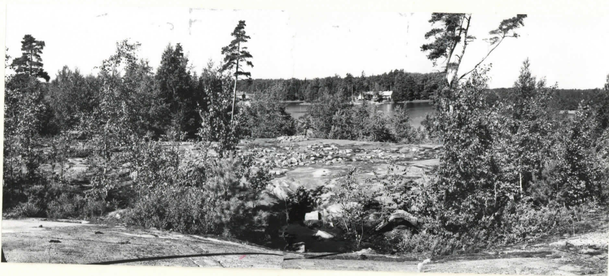
RÄFSÖN POHJOISPÄÄSSÄ SIJAITSEVAN RÖYKKIÖN JÄÄNNÖKSET. KUVA IDÄSTÄ.