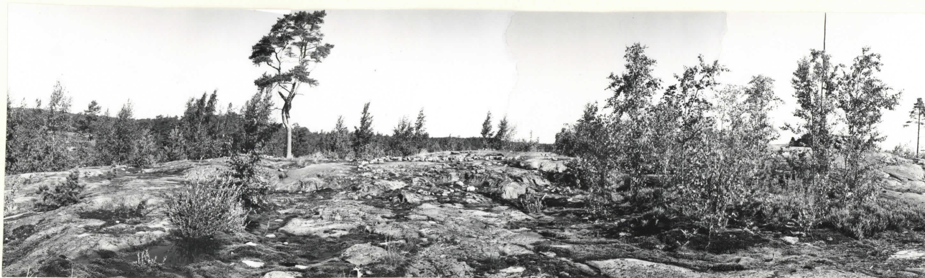
RÖYKKIÖN JÄÄNNÖKSIÄ RÄFSÖN KALLIOILLA. KUVA ETELÄSTÄ. ff. 39026-29.