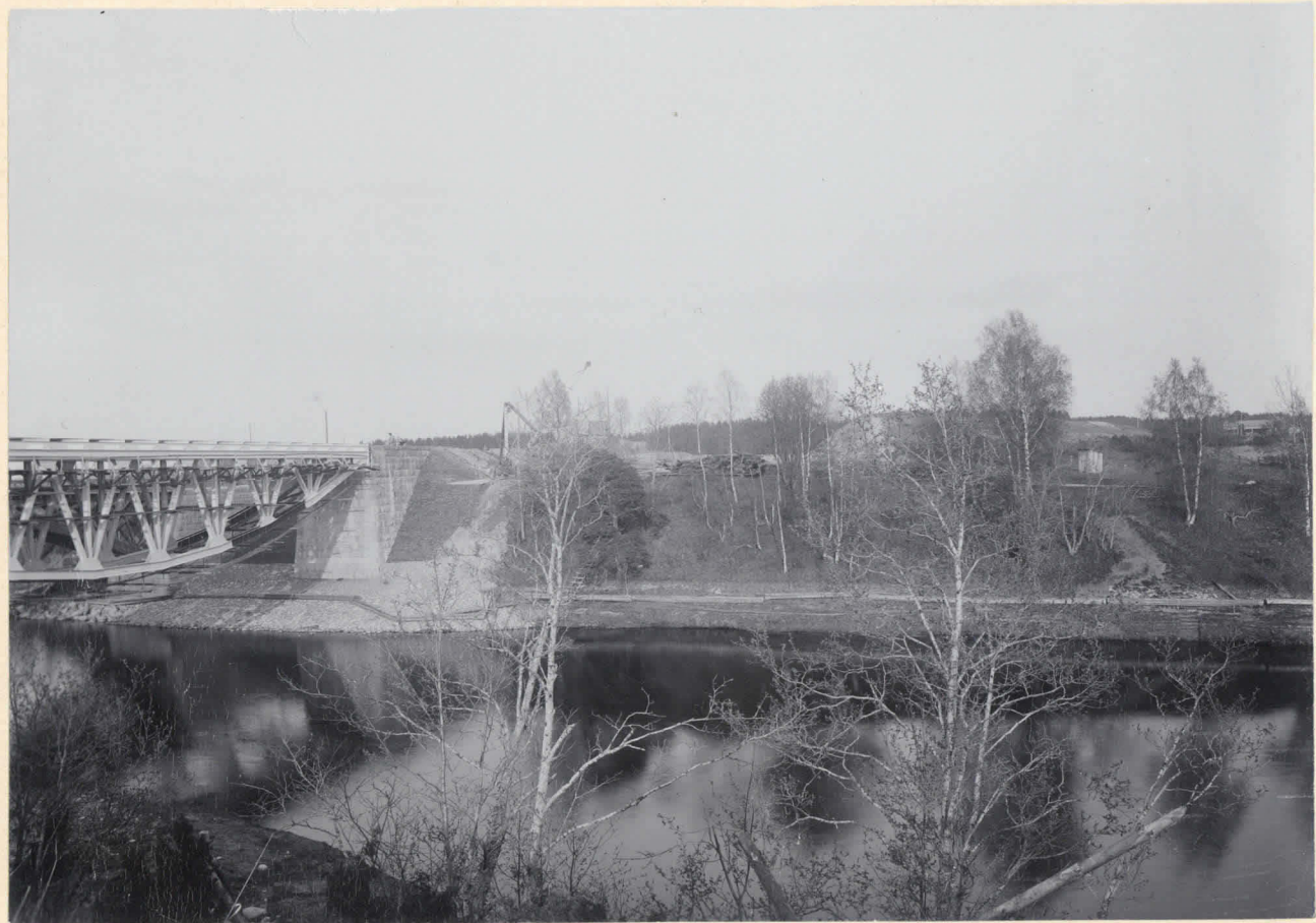
M. PL. 2822 Koskenkorvan harju Almajoella Kyrönjoen W. puolelta, jotenkin W. suunnasta