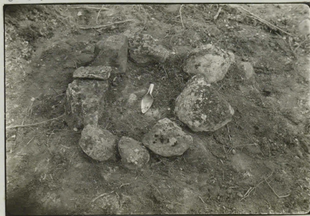
Tyylymyötkan liesi perattuna.