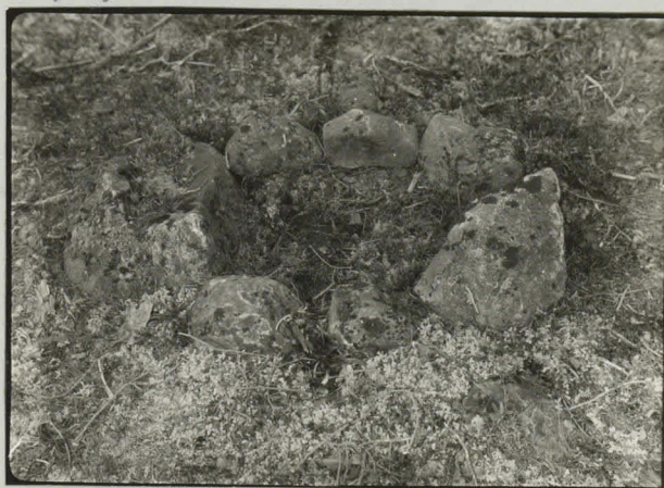
Tyylymyötkan liesi ennen kaivamista