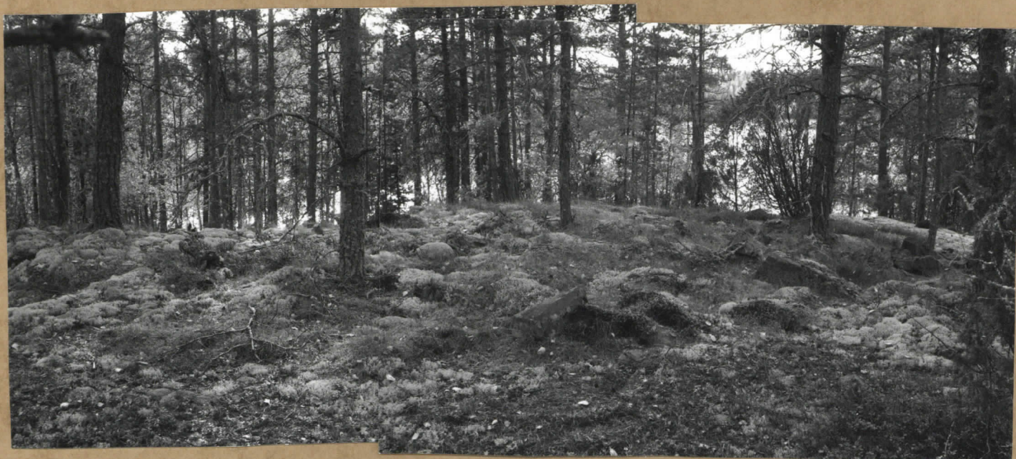
KUVA 2. LAPINRAUNIO. KUVATTU JÄRYELLE PÄIN.