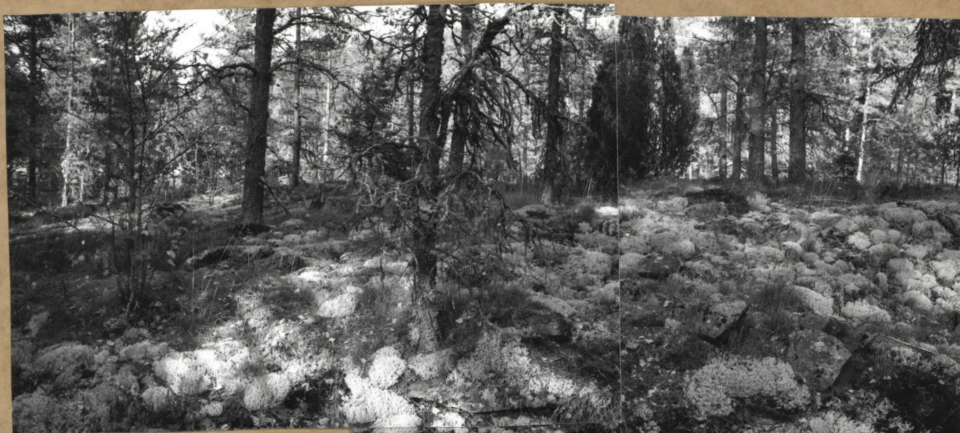
KUVA 1. LAPINRAUNIO. KUVATTU TOLENZIN TALON SUUNTAAN.