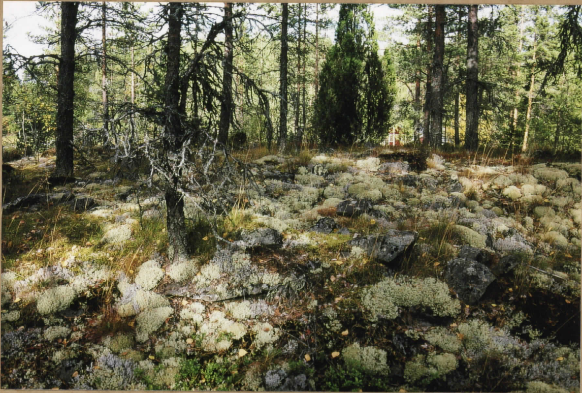
KUVA 3. LAPINRAUNIO. KUVATTU POLENZIN TALON SUUNTAAN. d. 36103