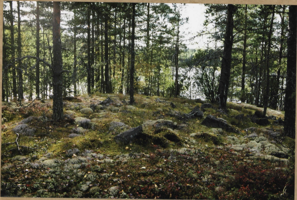
KUVA 4. LAPINRAUNIO. KUVATTU JÄRVELLE PÄIN. d. 36104