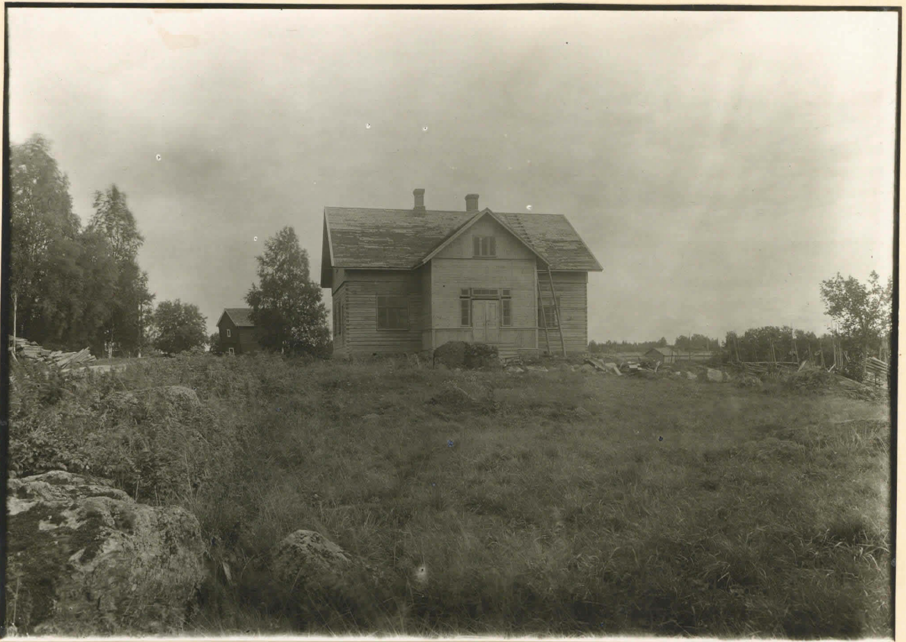
Pukkila, Palankylä, Isokyrö Eino Pukkineus sluga, fot. från N.