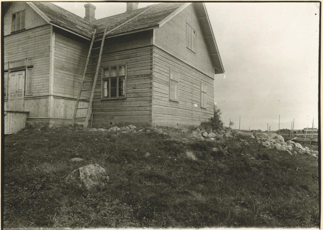
Pukkila, Palankylä, Isokyrö V-ändan af Eino Pukkineus sluga, med gräfsningsområdet, fot. från W.