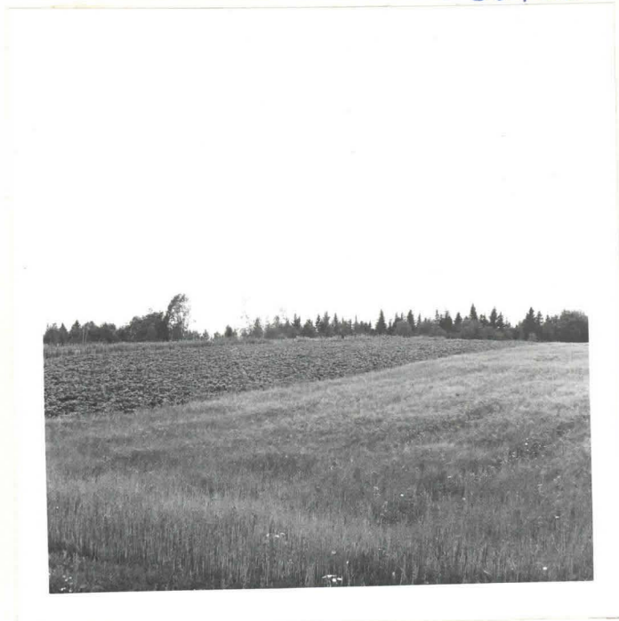
Hinkusalmen asuinpaikka omalla, kuvattu pohjoisesta, Riihen paikka metrikoilla vasemmassa reunassa.