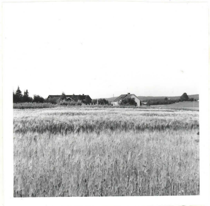
Kyntöläispellon asuinpaikka, kuvattu etelästä