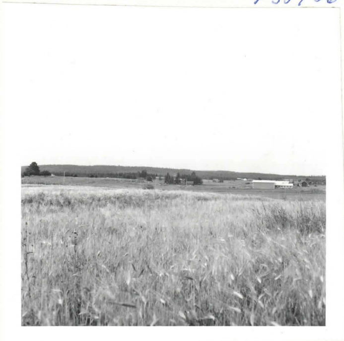
Hinkusalmen Kyntöläis- eli Riihi- pellon asuinpaikka ohrapellon, kuvattu louvaasta. Toistalle Hinkusalmen talo.