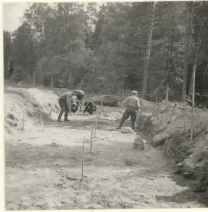
L. n:o 12.904

Alueen I: 1-13 kattuminen laaju- udessa.