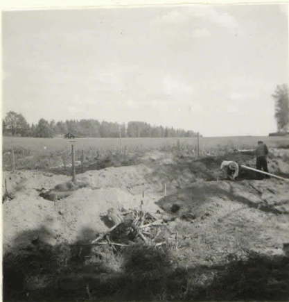
L. n:o 12.905

Alueen I-II ste- läpäät paljas- tettuna.