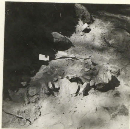
L. n:o 12.912 Kivetyt ruu- dissa I: 10.