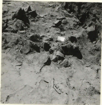
L. n:o 12.909 Kivetyt ruu- dissa I: 8.