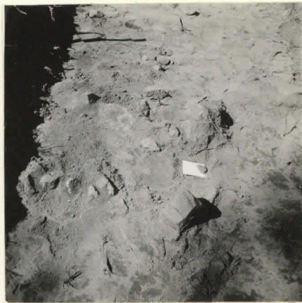
L. n:o 12.910 Kivetyt ruu- dissa I: 8.