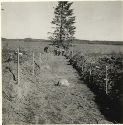
L. n:o 12.903

Alueen I: 1-13 kattuminen laaju- udessa.