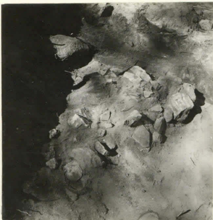
L. n:o 12.911 Kivetyt ruu- dissa I: 10.