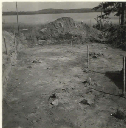
L. n:o 12.906

Kaivausaikal- ta Rehgleanjär- velle pain koho- ava rinne.