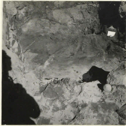
L. n:o 12.908 Palokkoppa ruudissa I: 3-4.