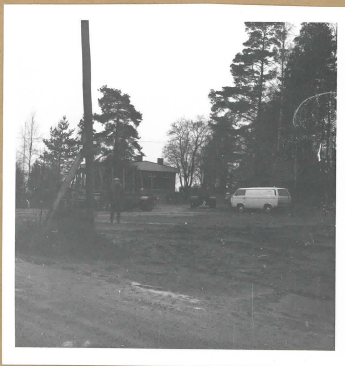
F. 63810. Löytöpaikka kuvattuna koillisesta. Esineet löytyivät välittömästi vasemmalla näkyvän puhelinpylvään pohjoispuolelta. Etualalla näkyy Lahti - Hämeenlinna-tieltä Kutjalaan vievää tietä. Taustalla Tervalan talo.