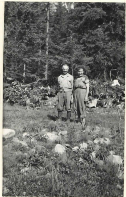
Kivilatomus - Kooki, Hyvänneulan kylä.