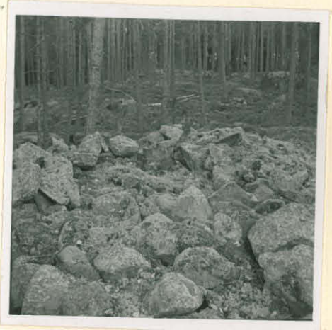
N.2. Oravisaarten raunion keskusta ja paasiarkku ete- lästä.