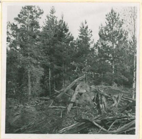
N.3. Metelinkinkaitten saarten Isokinkaalla oliva hives koillisesta.