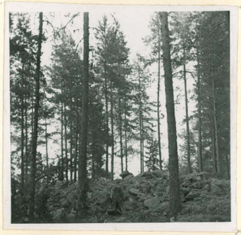
1. Oravisaaren raunio koillisesta.