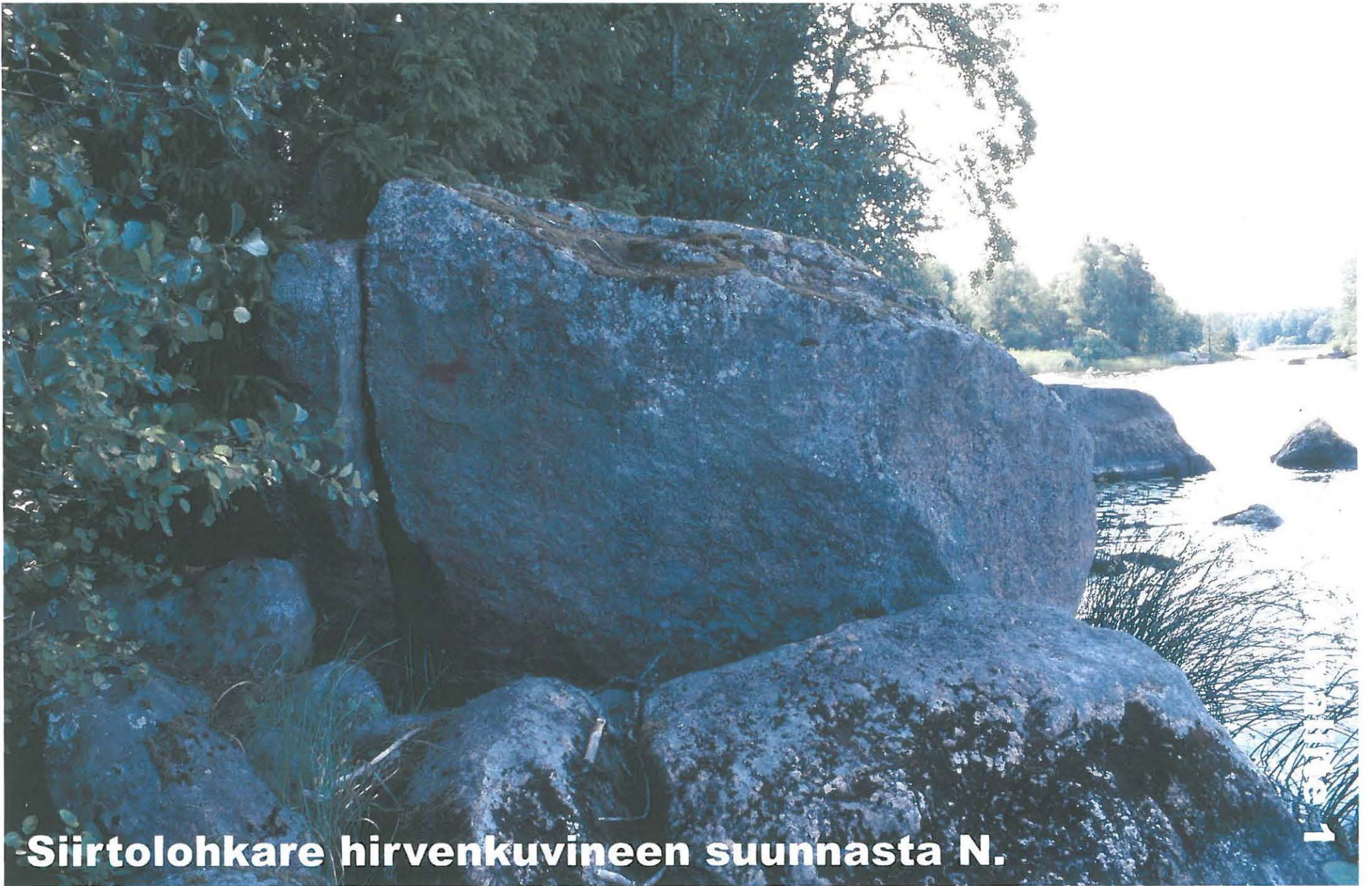
-Siirtolohkare hirvenkuvineen suunnasta N.