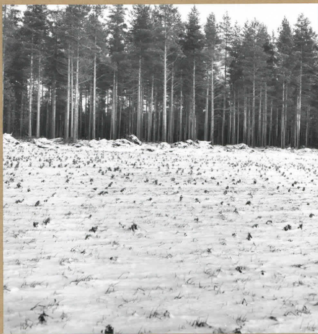
4. Luoman kiveksentinen asuinpaikka pellolla ja metsä"ssa". W. 59432