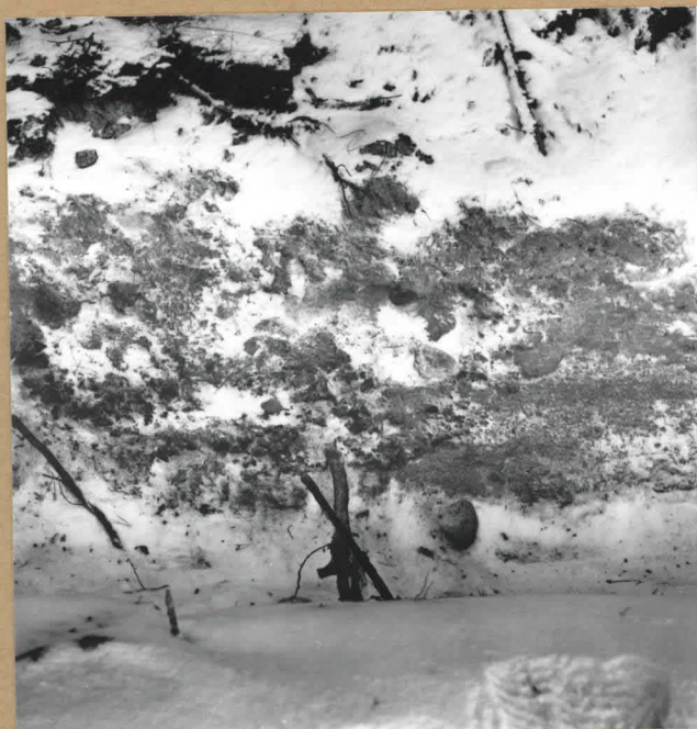
2. Liesi pelto-ajan leikkauksessa. W. 59429