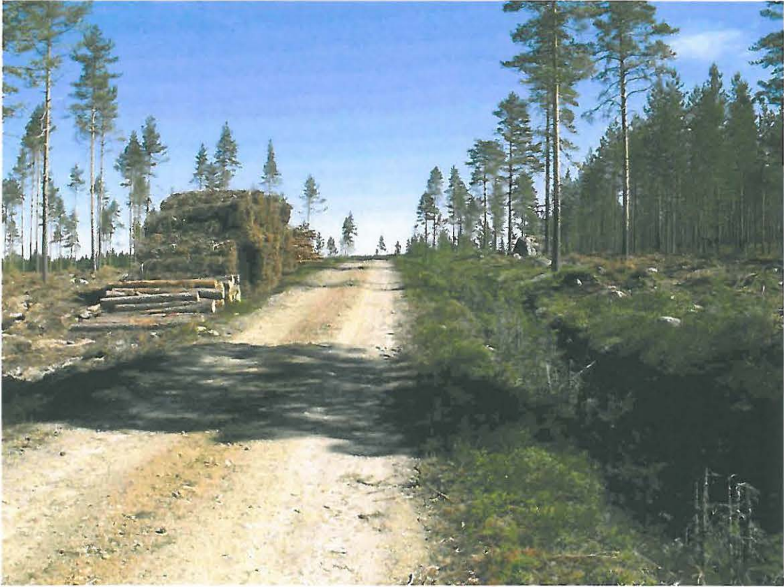
Kuva 1. Yleiskuva alueesta. Asuinpaikka-alueen läpi kulkee metsäautotie. Kivikautisia asuinpaikkalöytöjä tuli äestysurista esiin tien molemmin puolin. Asumuspainanteet sijaitsivat tien oikealla puolella.