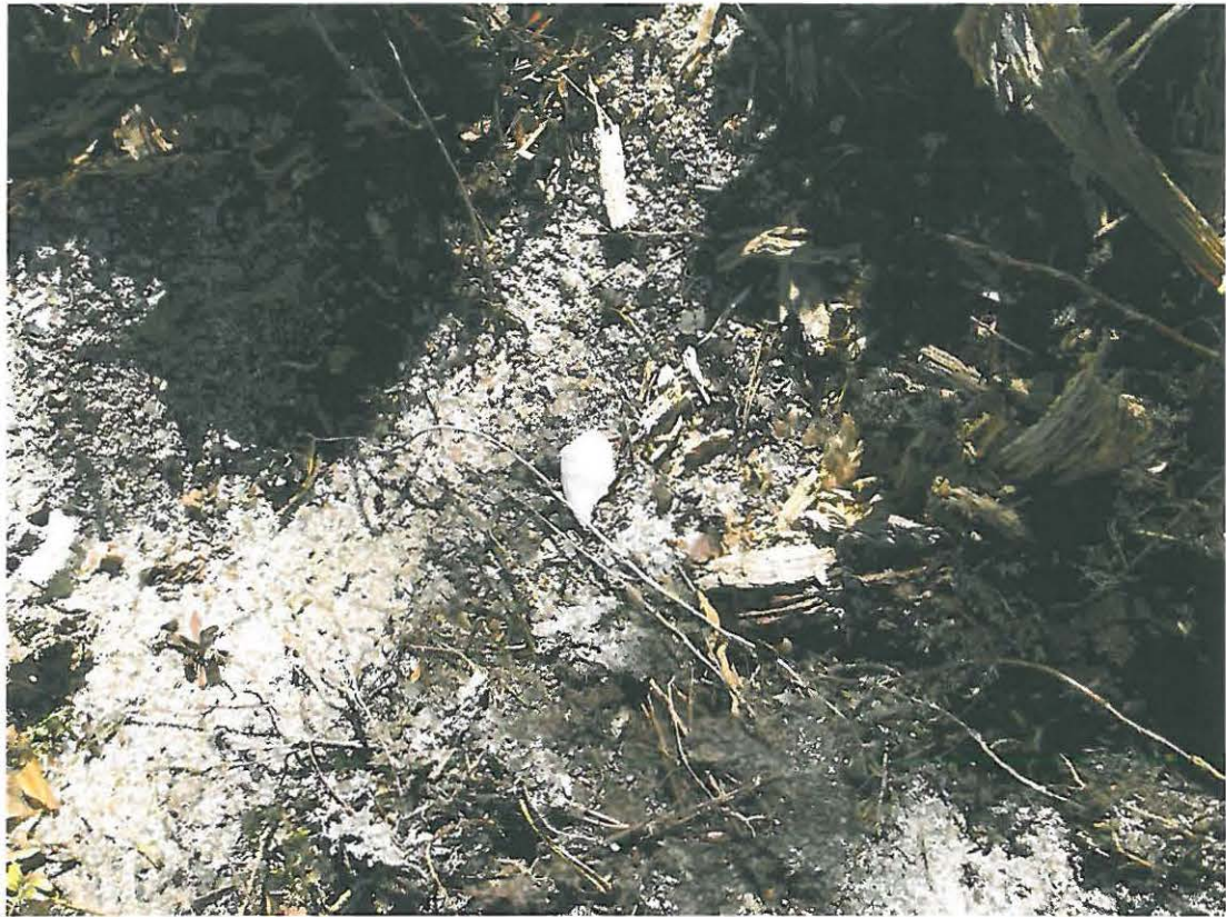
Kuva 5. Äestysurista esiin tullutta kvartsia.