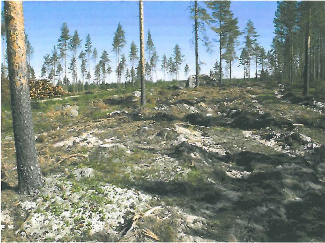
Kuva 3. Äestettyä asuinpaikka-aluetta.