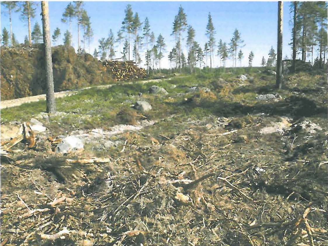
Kuva 2. Etualalla asumuspainanne, jonka yli äestysurat kulkevat.