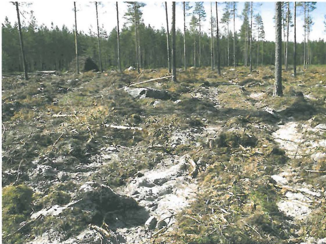
Kuva 4. Tien vasemmalla puolella olevaa hakkuualuetta. Äestysurissa oli näkyvissä runsaasti kvartsi-iskoksia.