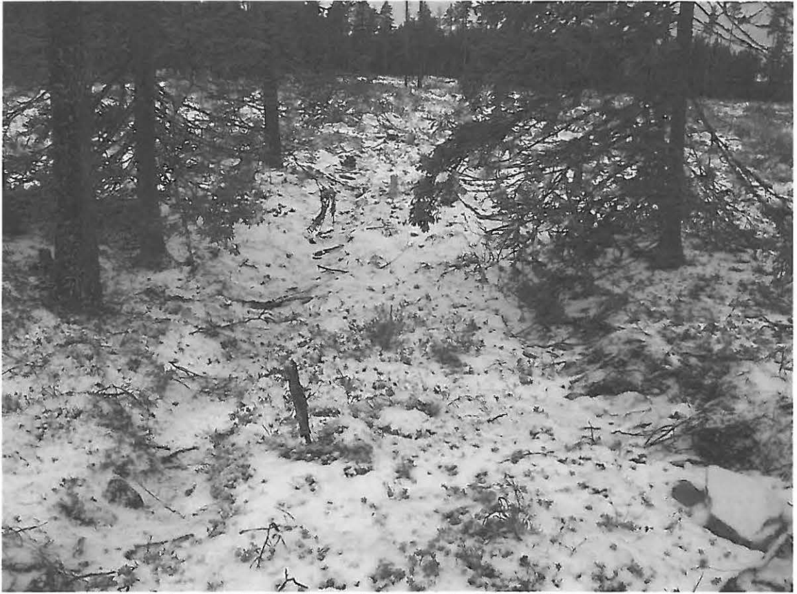
Kuva 5. Asumuspainanne, jonka yli on ajettu metsätyökoneella.