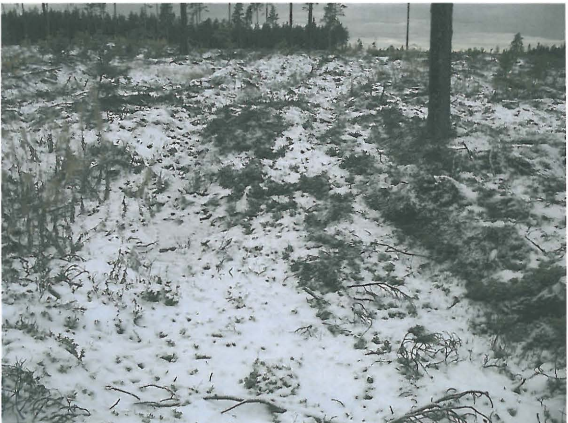
Kuva 4. Asumuspainanne, jonka yli on ajettu metsätyökoneella.