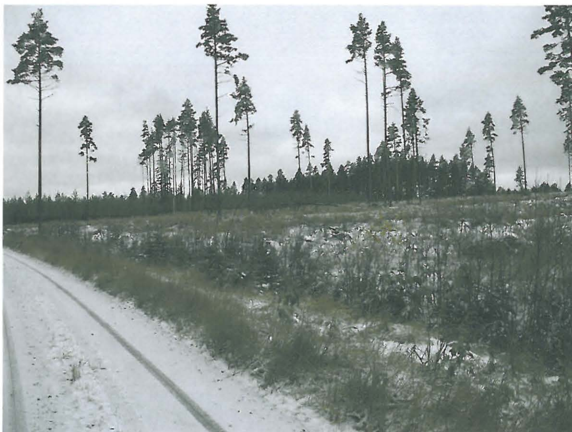
Kuva 1. Yleiskuva hakkuualueesta.