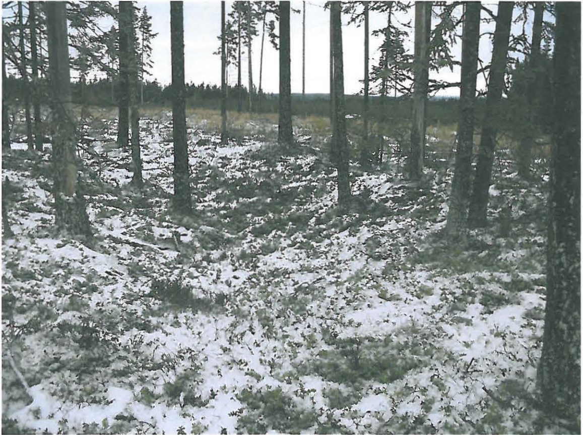
Kuva 3. Ehjä ja säilynyt asumuspainanne, joka on myös kohteen suurin.