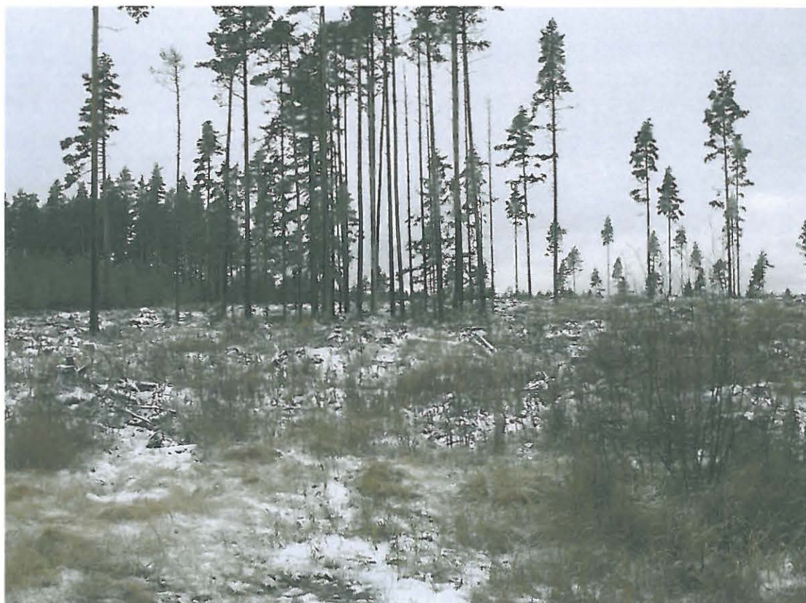
Kuva 2. Yleiskuva hakkuualueesta. Ehjä, kokonaan säilynyt asumuspainanne sijaitsee alueelle jätettyjen mäntyjen keskellä.